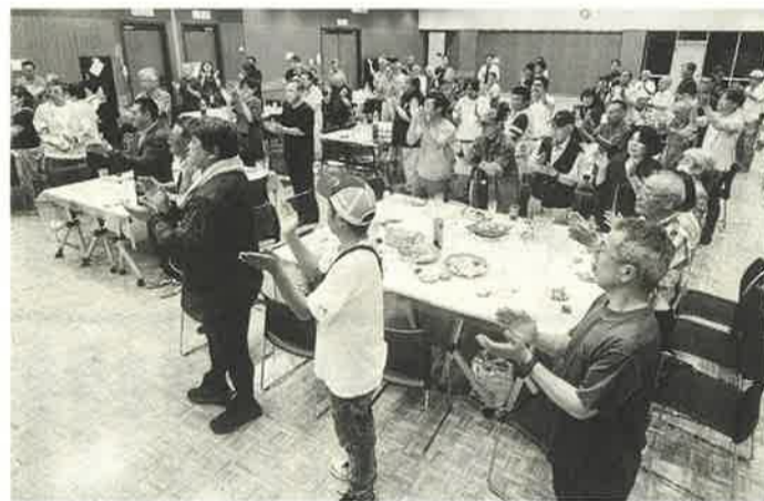
三本締めで「お疲れさまでした」