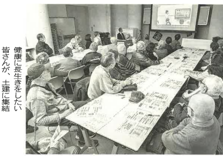
健康に長生きをしたい皆さんが、土建に集結