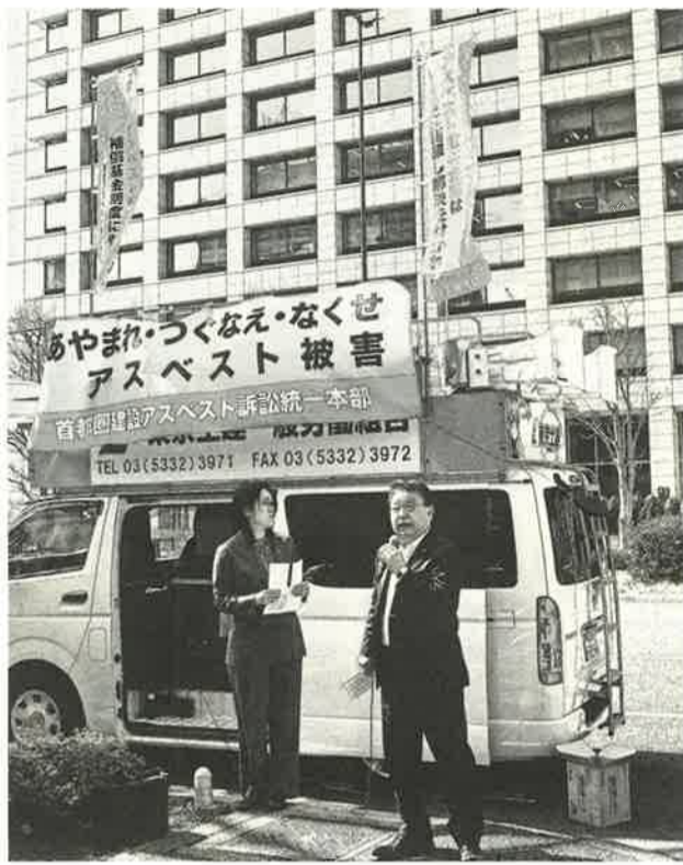
東京地裁前で早期解決を訴える

【志賀昭夫通信員・立花分會】2008年から国や建材メーカーと争っている「首都圏建設アスベスト訴訟」。その東京4陣訴訟の第17回期日が3月17日にあり、立花分會の仲間とともに5名で参加しました。 午後1時、東京地裁の前に集合し、集会が行われ、1時30分に傍聴の抽選が行われ、かなのにも緊張しました。不謹慎かもしれませんが、法廷でのやりとりがある種の感動を覚えてしまいましたが、写真や資料が不きれ、肺ガンの健康状態などが説明され、原告のみなさんご苦勞や悲痛な訴えを聞かすに、改めて早期解決を