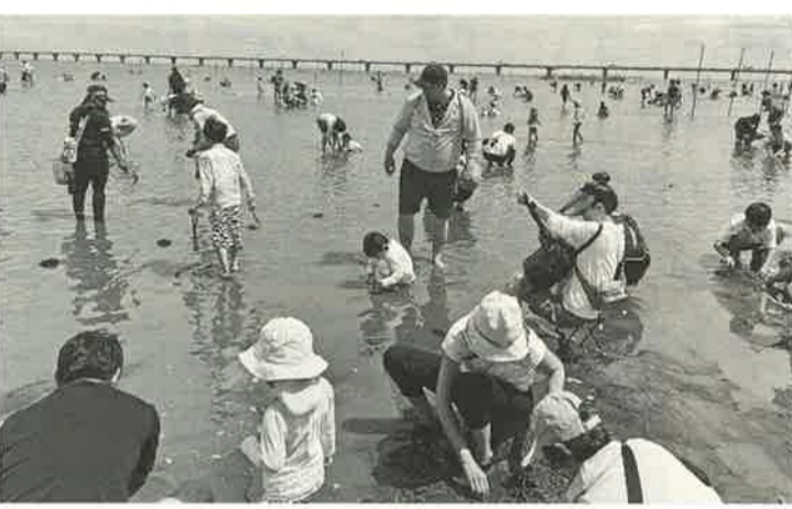
大人も子どもも夢中になれます！

毎年好評の大人気企画、後継者対策部主催の「潮干狩りバスハイク」が今年も開催されます。 5月31日(日)、墨田支部会館前に午前7時30分に集合し、「牛込海岸潮干狩り場」でアサリをいっばい採って、「漁師料理」で海の幸を堪能し、「はちみつとミードのはちみつ工房」で工場見学をして、「四季の蔵 包彩」でおみやげを買うというゴールデンコースです。 今ちまたでは、家族みんなで気軽に楽しめる日帰りバス旅行が流行っていますが、物価高騰で燃料代等も上がり、1人12000～13000円 お父さんは「バスで行くから運転しなくて良い」、お母さんは「会費が安くて家計にやさしい」、お子さんたちは「貝もお魚もはちみつも美味しい」と家族みんなが大満足のイベントです。 メールマガジンに登録されている方はご案内をお送りしています。 お問い合わせは墨田支部後継者対策部(03-3614-3806)まで。お申し込みは会費を添えて支部窓口まで。定員になり次第、受付終了となりますので、お早めにお申し込みください。