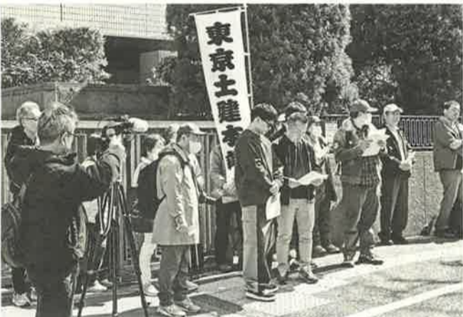
東京土建本部・各支部の仲間のみなさんも参加

【志賀昭夫通信員・立花分會】2008年から国や建材メーカーと争っている「首都圏建設アスベスト訴訟」。その東京4陣訴訟の第17回期日が3月17日にあり、立花分會の仲間とともに5名で参加しました。 午後1時、東京地裁の前に集合し、集会が行われ、1時30分に傍聴の抽選が行われ、かなのにも緊張しました。不謹慎かもしれませんが、法廷でのやりとりがある種の感動を覚えてしまいましたが、写真や資料が不きれ、肺ガンの健康状態などが説明され、原告のみなさんご苦勞や悲痛な訴えを聞かすに、改めて早期解決を