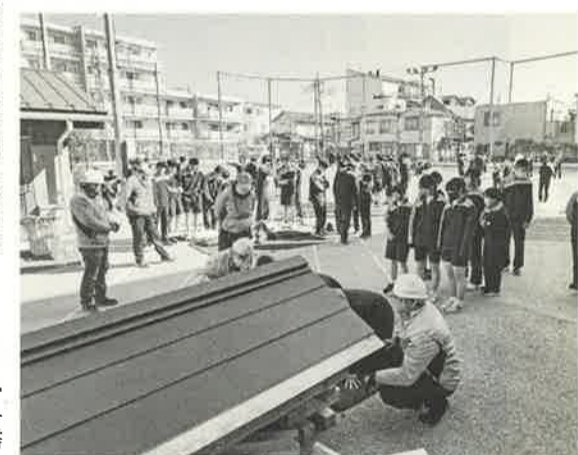
校庭全体でさまざまな訓練を実施

3月11日、吾嬭二中の防災訓練に、ハンマースが参加しました。この訓練は、毎年東日本大震災の時期に、まもなく卒業を迎える中学三年生を対象に行なわれているのですが、今回の三年生は平成22年4月2日(平成23年4月1日生まれ)というので、平成23年3月11日に発生した震災の記憶がなく、発生後に生まれたという生徒さんはいました。 ハンマースは、校庭に倒壊家屋の模型を持ち込