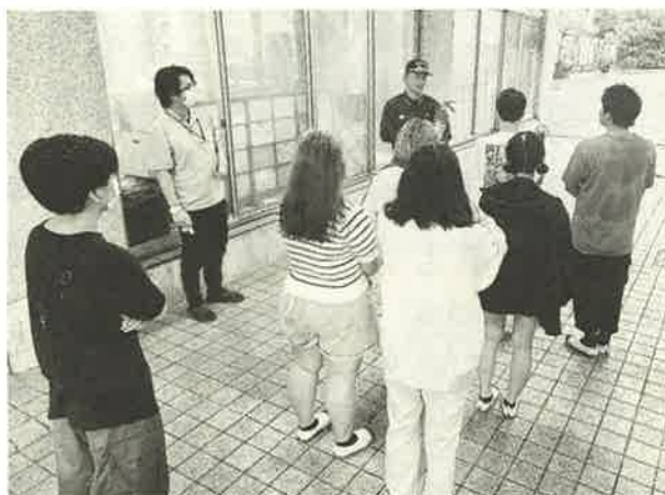
ハンマーズの隣では向島消防署が防水訓練を実施