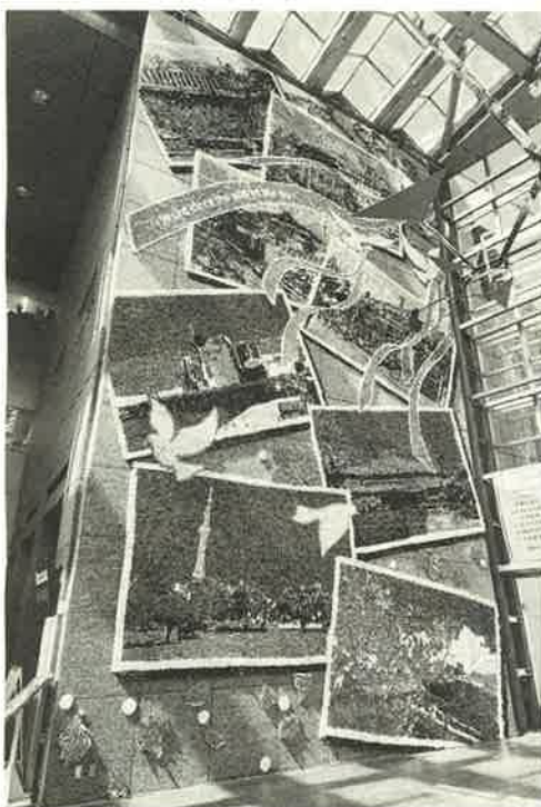
約10万羽の巨大折り鶴アート 「平和のオブジェ」

今年のオブジェは「終戦から80年～歴史から学び、未来へ」をテーマに、たび重なる災害を乗り越え、今日のすまだを築いてきた人々、明日の