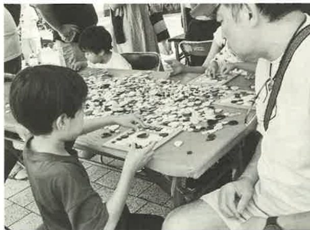
熱くても夢中になっちゃう大人気のタイル鍋敷きづくり

で、登校できない学生さんという訓練を行ないました。やみくもに助けるのではなく、救助者を見つけ