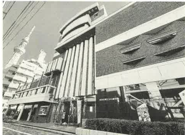
小梅小学校の隣にあります すみだ郷土文化資料館

長い歴史や伝統を持つ「すみだ」の郷土や文化を後世に伝えることも、貴重な歴史・民族資料等を収集・保存・活用し、区民の知的・文化的創造力を育む活動を行なう空襲被害写真、戦争遺跡と空襲死者追悼など、86点が展示されています。