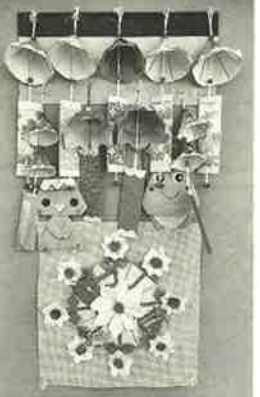
ふうりんとうひまわり