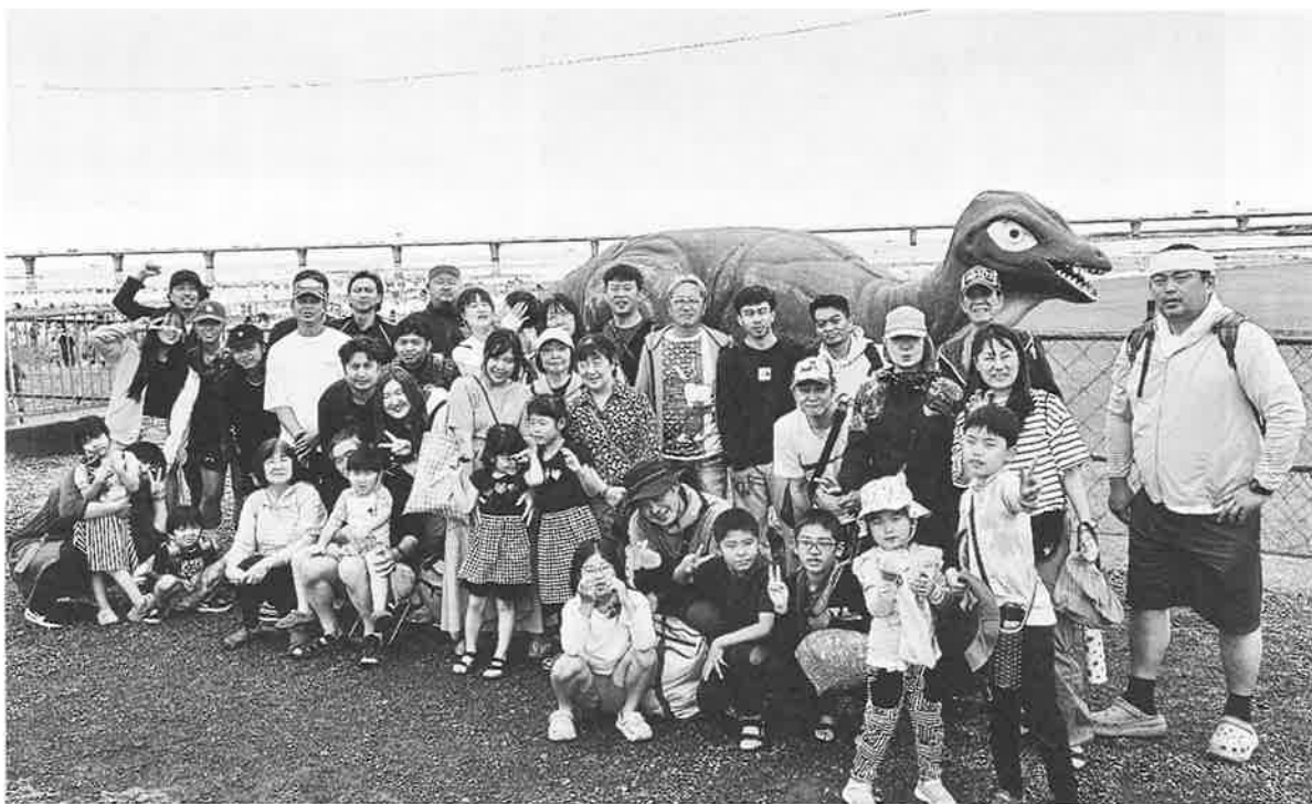
子どもも大人もみんな笑顔