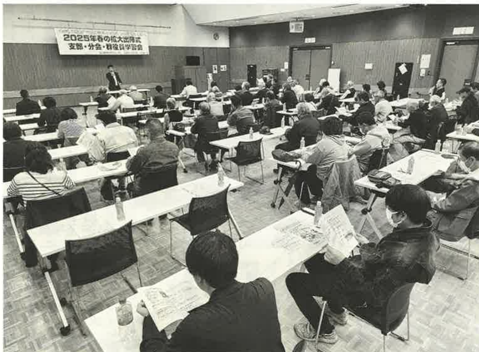
マイナ保険証の問題点等について学習

4月10日(木)、曳舟文化センター2階レクリエーションホールにて、支部・分会・群役員学習会 兼 春の拡大出陣式が行われました。役員学習会では、昨年12月から新規発行が出来なくなった健康保険証について、その影響と今後の運動課題について学び、後半の拡大出陣式では、各分会からの新加入者報告もあり、春の拡大(新たな組合員を増やす)月間が始まりました。