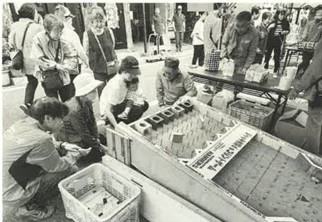
台東支部の指導もバッチリ ジャッキアップコリントゲーム