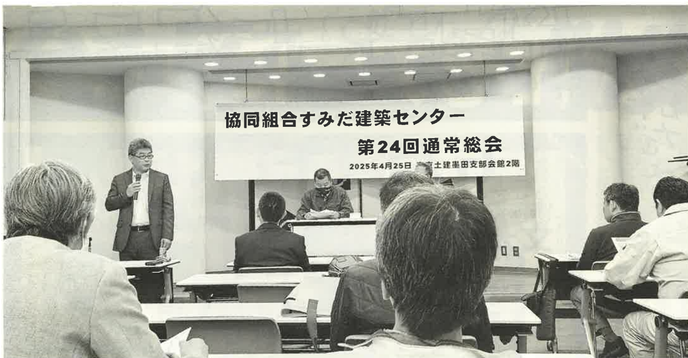
おかげさまで24回目の総会を迎えました