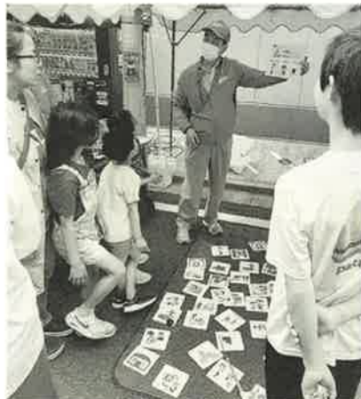
解説が熱い 防災釣りゲーム