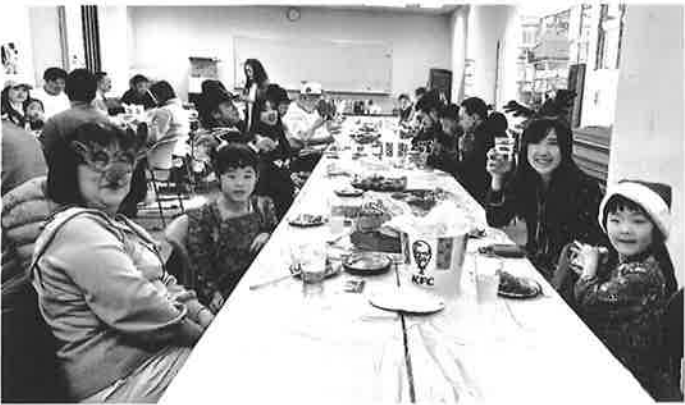
みんなと一緒だともっと楽しい

【永瀬後継者対策部長】料理を食べるのは久しぶり12月15日(日)後継者対策部クリスマスパーティーを開催しました。恒例だったボウリング大会が開催困難になったため昨年から始めた試みでしたが、非常に好評だったので今年も開催したところ、昨年を上回る反響で、当日に飛び入り参加してくれた家族も。小さなお子さん11人を含む40人が来場し、料理とお酒で盛り上がりました。 クリスマスソングが流れ、レザやチキン、オードブルなど雰囲気たっぷりのメニューが並び、大人向けにはお寿司やおでん、デザートにはケーキバイキングも用意。みんなにクリスマスっぽい料理を食べるのは久しぶりと喜びの声を多数聞かれました。 子も向けに用意したリース作りコーナーも大盛況。親子でかわいいうす作りに挑戦する様子に、 最後はおもちゃを巡って笑いあり涙ありの抽選会。大人にもカニや牛肉など豪華食材にギフトカードなど大盤振る舞いで盛り上がりました。 終了後、部員で少しだけ打ち上げ。今年は大成功でした。とみな口を揃えて喜びました。やっぱり子どもたちが楽しそうにしているのが何より嬉しいし、これからもそんなイベントを後継者対策部で開催していきたいです。