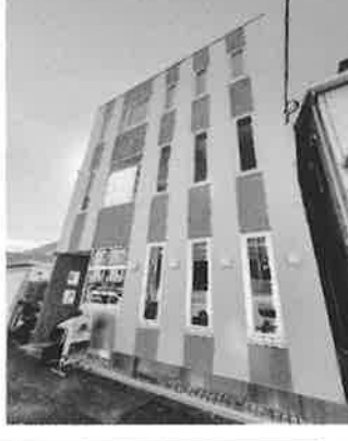
ファミリーマート 八広六丁目店の目の前