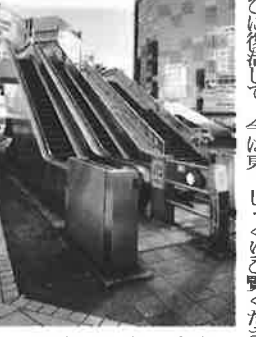
大雨が降っても大丈夫。元祖屋外エスカレーター

京の東側を代表する駅になりました。でも自慢の場所は錦糸町駅ではないんです。「錦糸町駅南口歩道橋のエスカレーター」です。普段何気なく利用しているこのエスカレーターですが、「雨ざらし」ってスゴイと思います。しかも諸説ありますが日本でも初めて外に設置されたエスカレーターです。大正時代の「錦糸町駅」に改名されたそうです。関東大震災と東京大空襲、2回も壊滅的な被害を受けましたが、そのたびに復活して、今は東