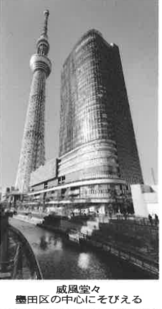
威風堂々 墨田区の中心にそびえる