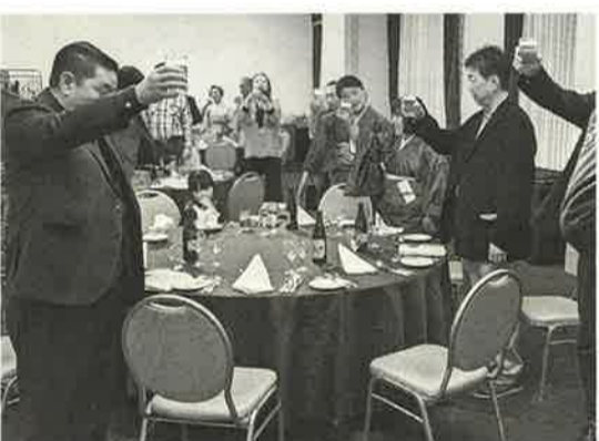
「乾杯！」の声で、本分会らしい豪快な会が始まる

4年ぶりの「乾杯」 本所第一分会 第一ホテル新年会 1月27日(土)第一ホテルの南部を地域に活動している組合員は区外に住んでる方がほとんどで活動新年会を開催しました。でも事業所の多い地域になかなか参加出来ず、本所第一分会は、墨田で、事業所に所属している取り組みや情報を伝える