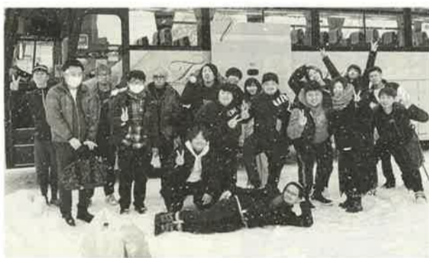
支部を越えた交流は大成功。また来年もこのメンバーで行きたい

【本部青年部・長沼大生副部長】墨田・江東・江戸川支部から構成される江東ブロック青年部で、1月7日・8日の二日間でスキースノボレクを開催しました。墨田支部からは3人が参加し、3支部合わせて19人が参加しました。ゲレンデは新潟県南魚沼市にあるムイカスノーリゾート。初級者から上級者まで思い思いに滑りを楽しみ夜はみんなで美味しいご飯。朝は「初めまして」だった参加者たちはすっかり打ち解けました。二日目はお酒が残っていない人だけゲレンデへ。目一杯楽しんで、ヘトヘトで帰路につきました。ブロックの交流は久しぶりで、支部を越えて多くの青年が交流することはとても有意義でした。「来年もまた行こう！」と交わした約束が果たせるよう、墨田支部青年部を盛り上げていきます！