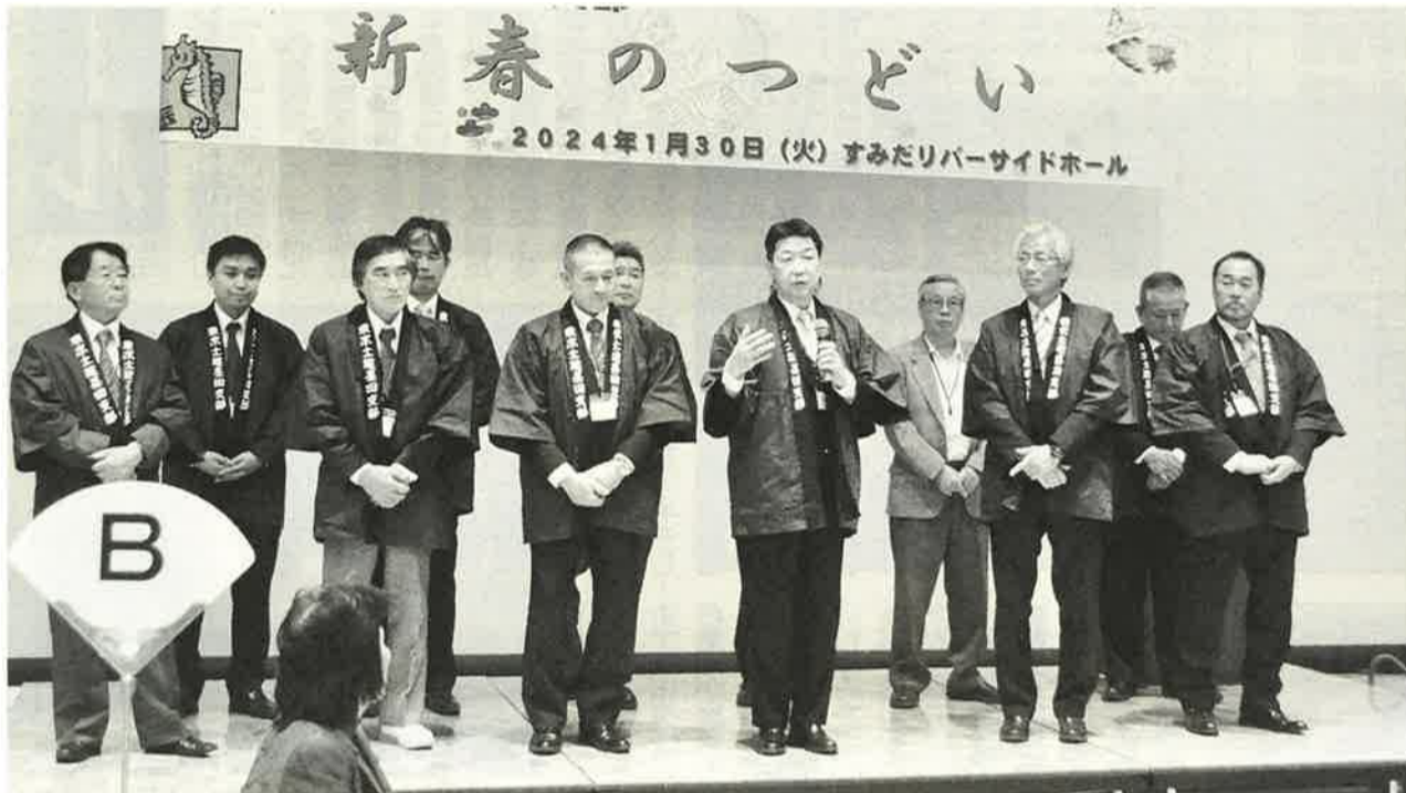
役員勢揃いであいさつ。防災活動について語る福井副委員長（中央）の言葉に、参加者は傾き聞き入る