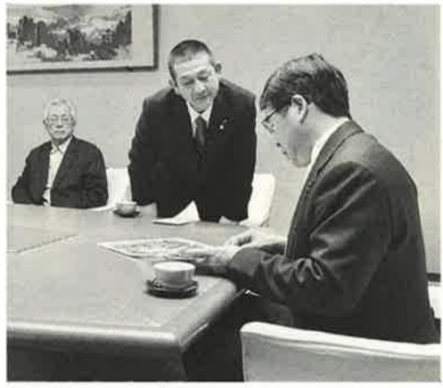
住宅デーの写真を嬉しそうに眺める区長。日々の活動を伝えていく事が大切

住宅デーで集まった募金を手渡し、住宅デーの様子を納めた写真を見せながら墨田支部の取り組みを報告。墨田支部の報告を受け、区長らには大変喜んでいただけました。