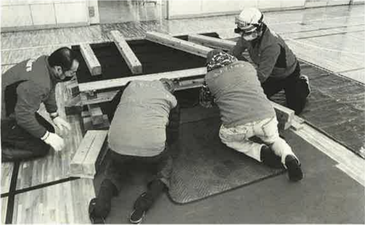
ハンマーズと町会のコラボ。この日も倒壊家屋型は大活躍

八広分会や向島消防署が提供すると、毛布で作る簡易たなか。身近にあるもので誰かを救うことができる。