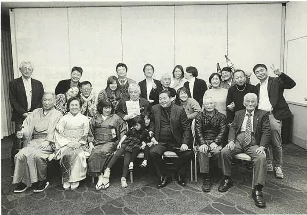
4年ぶりの本所第一分会新年会に、一同喜びの表情を浮かべる。ホテル開催ということで、正装でピシッと決まってる