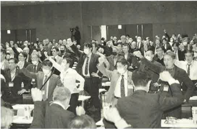
全都から集結した仲間の団結ガンパローは圧巻