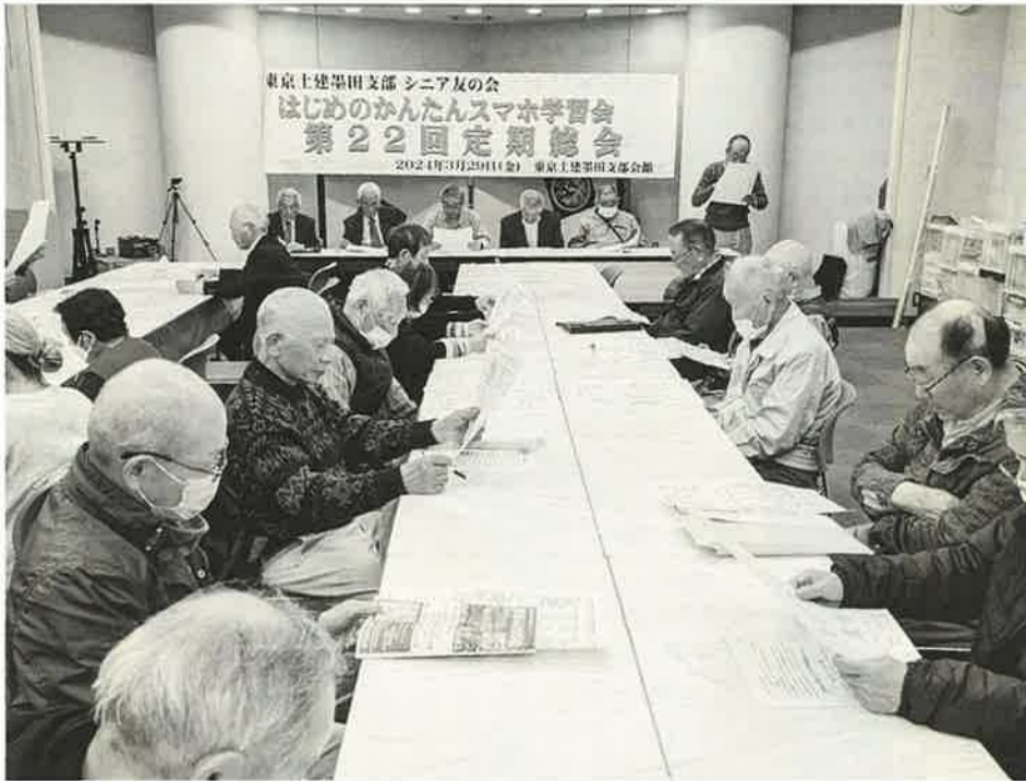
スマホ学習を兼ねた総会は、大勢の人が参加して大盛況だった