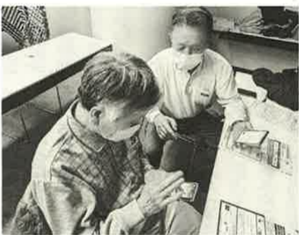
仲間同士でも教え合う