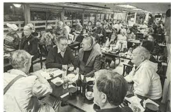
屋形船では大宴会のシニア友の会