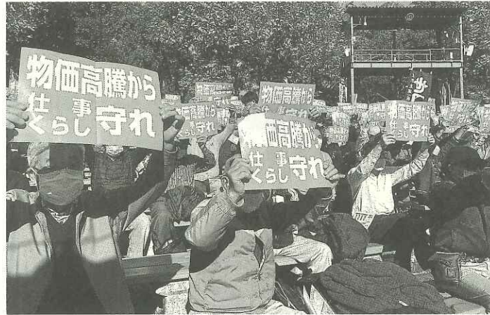
職人の生活を守る予算編成を要求していく。会場は、プラカード鮮やかな色に染まった

10時に開会、「2023年度東京都予算要求、仕事と就労確保、諸要求実現、建設国保組合への現行水準確保」をテーマに、都連菅原委員長・来賓の挨拶、都連堀井書記長の基調報告と続き、11時に「暮らしを守るための予算要求をプラカードでアピール。そして3年ぶりのデモ行進を、日比谷公園へ。都庁での集いが終わるとなるデモ行進を、日比谷から銀座、東京駅周辺まで行い建設職人の処遇改善を訴えました。中央決起集会」に参加。東京土建以外にも全国各地から仲間が集結し、全体で