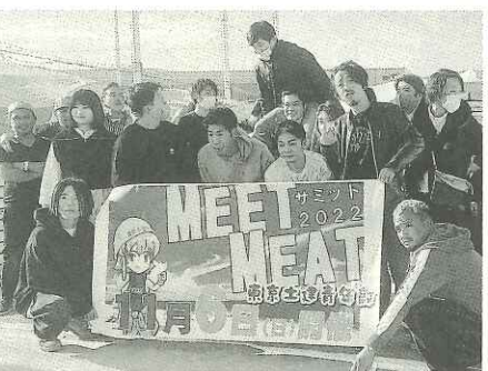
全都の青年部がタチヒに大集合

11月6日(日)、立川市のタチヒビーチには計4名が参加しました。青年部バーベキュー「MEET MEAT」久しぶりの結果、一同「ミット2022」が開