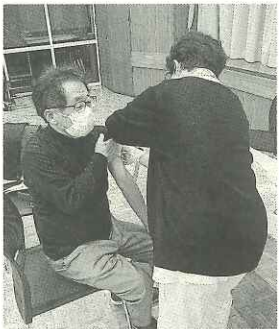
接種と霧島部 霧島部 霧島部