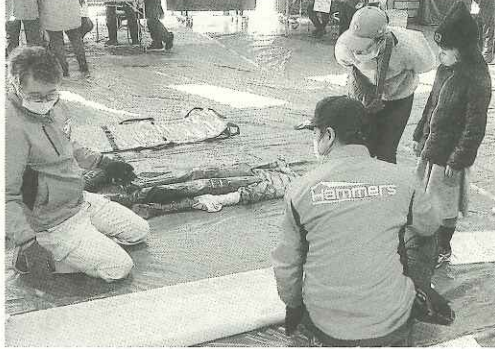
毛布や洋服を使った簡易タンカ作りを教える様子