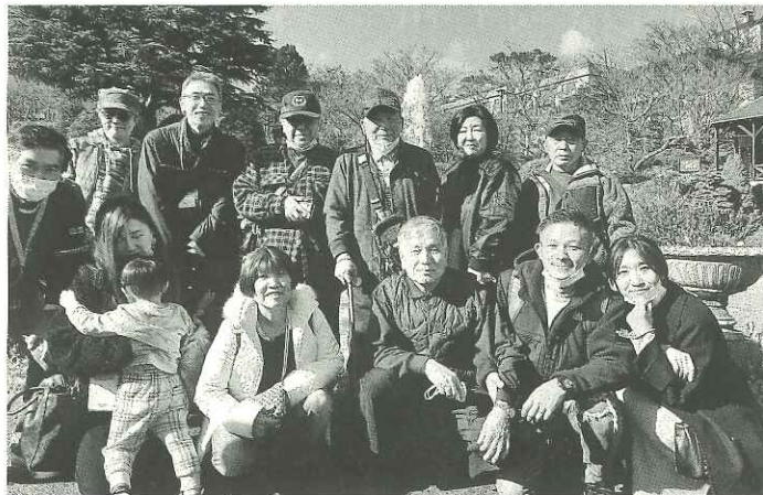
久しぶりのレクリエーションにウキウキの本二分会。天候にも恵まれた