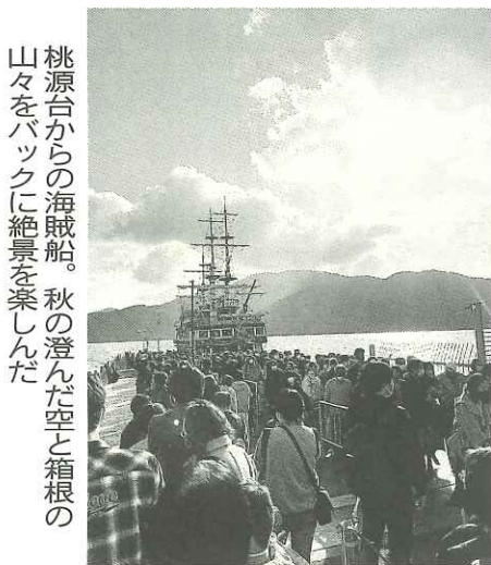
桃源台からの海賊船。秋の澄んだ空と箱根の山々をバックに絶景を楽しんだ

乗りの大涌谷に向かう予定でしたが、機械故障のため乗ることができず、急遽予定を変更し、メインのレクリエーションは分會の結束力を強化できた台に向かいました。