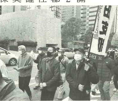
3年ぶりのデモ行進に背筋が伸びる。銀座は人であふれていた

予算要求集会開催 午前は対都要請！ 11月18日(金)、都庁第二庁舎にて、全都建設労働者対都要請行動が行われ、庁舎前は多くの人