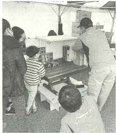
家具転倒の怖さを、模型で体験。転倒防止器具の大切さがよくわかる

11月20日(日)、錦糸公園で墨田区総合防災訓練とあり、各ブラスカを練り、東京土建墨田支部は東京建設産業組合と共に防災学習エリアでブラスカを設け、ハンマースを中心とした参加者が参加しました。新型コロナウイルス流行による中止が続き、3年ぶりの開催でしたが、当日はなんと持ちこたえ、多くの人が賑わいました。錦糸公園全域を使用し、家具転倒防止模型体験を設け、参加者が力を合わせ、代わる代わる対応をしながら、子ども連れの中心に終始長蛇の列。休む暇もない大盛況でした。