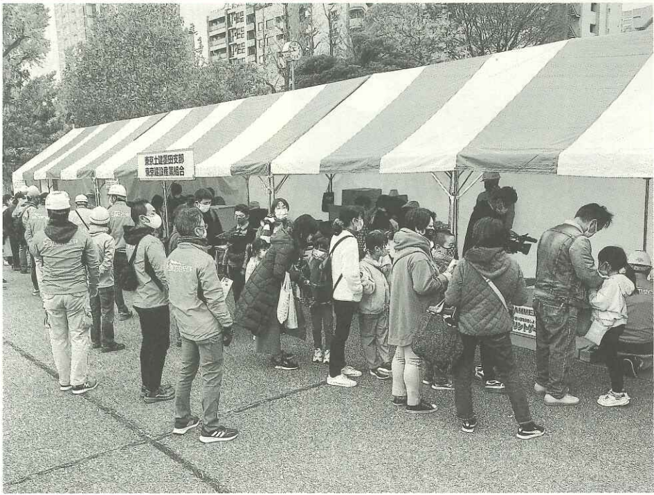
大人気のジャッキアップコリントゲームは、終始長蛇の列だった。初めてのジャッキと景品のお菓자에、子どもたちは大興奮！

東京土建一般労働組合 江東ブロック会議 江東区北砂1-11-4 TEL [3640]2411 発行者 実川英治 新聞代は組合費に含まれています 定価30円