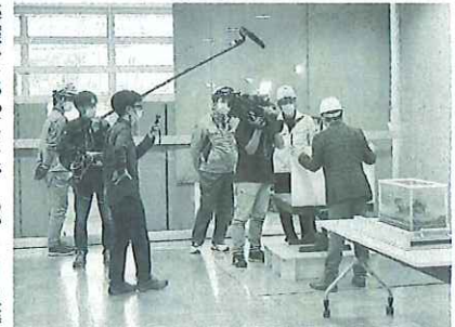
家具転倒防止模型を体験。カメラにすっきり慣れてきたハンマーズ