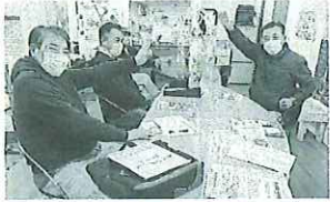
「訪問100件を目指します」と意気込む、あつま分会の生芝分会長(右)

東京土建に入るとたくさんのメリットがあります。これをしっかりと広めていきましょう。引き続きよろしくお願いします。