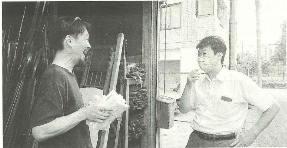
久しぶりの対面。自然と笑みがこぼれる