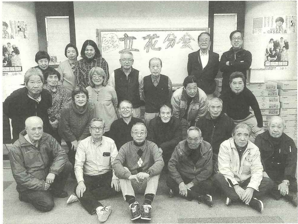
新たなスタートを切る立花分会。苦難の新年度となったが、笑顔で乗り越えていきたい