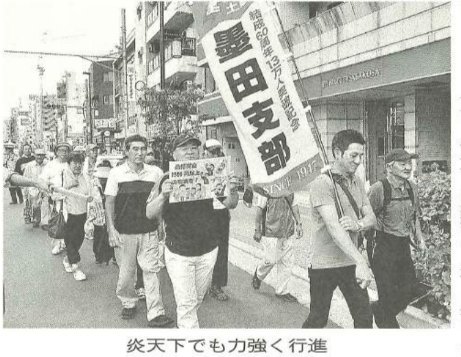
理不尽な増税には怒りの声を

消費増税を絶対に許さないー9月8日(日)、墨田支部では今年「2019世直し雷大行進」に参加しました。9月に入り涼しくなってきたのでしたが、この日は猛烈な日差しに苦しめられました。花川戸公園から吾妻橋のコースを、ちんどん屋を先頭に元気なシュプレヒコールする様子には、観光の外国人たちも興味津々。手を振ってくれたり写真を撮ったり、浅草の街は大盛り上がりとなったのです。10月から始まった増税と複数税率。重すぎる負担に複雑すぎる軽減税率、多くの人が苦しめられることになりました。まずはこの不可解極まりない税制度を廃止させ、そして消費税の引き下げ、これらの要求を勝ち取るため、我々は声を上げ闘い続けなければなりません。そのために、これからこの雷大行進に参加しシュプレヒコールを続けましょう。ご参加いただいた方々、暑い中での行進、本当にお疲れ様でした。これからも、ご協力をお願い申し上げます。