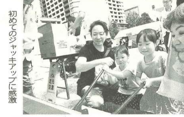
初めてのジャッキアップに感激