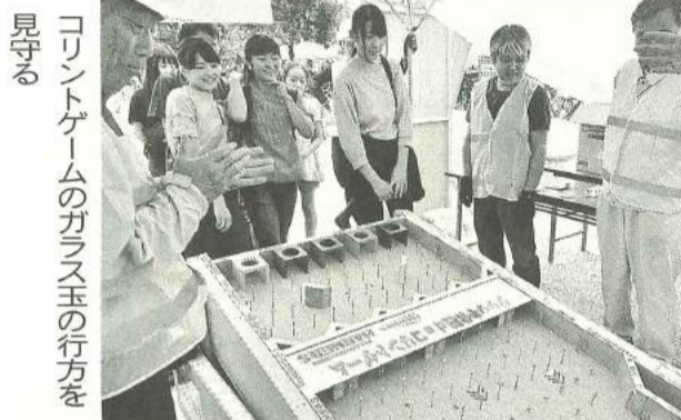
コリントゲームのガラス玉の行方を 見守る

やはり目玉といえば「ジャッキアップdeコリントゲーム」です。見慣れないジャッキを使って重い木の箱をいとも簡単に持ち上げる感覚、美しいガラス玉を釘の隙間に転がす楽しさ、子供心をくすぐる景品、このコーナーは終始長蛇の列でした。楽しく防災を学ぶと