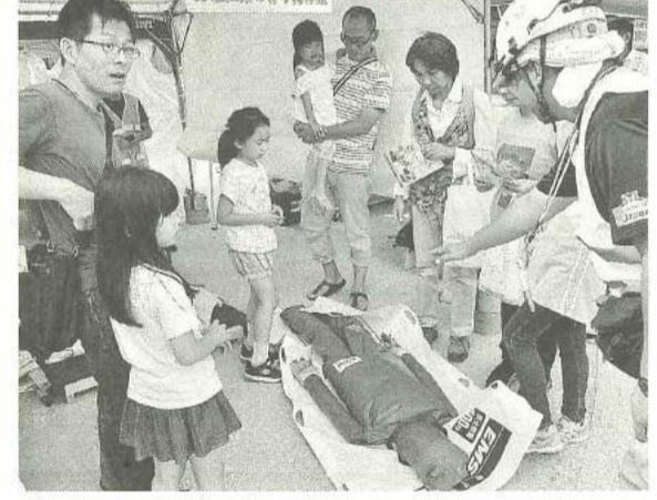
しっかりと担架の使い方を学び、未来に備える