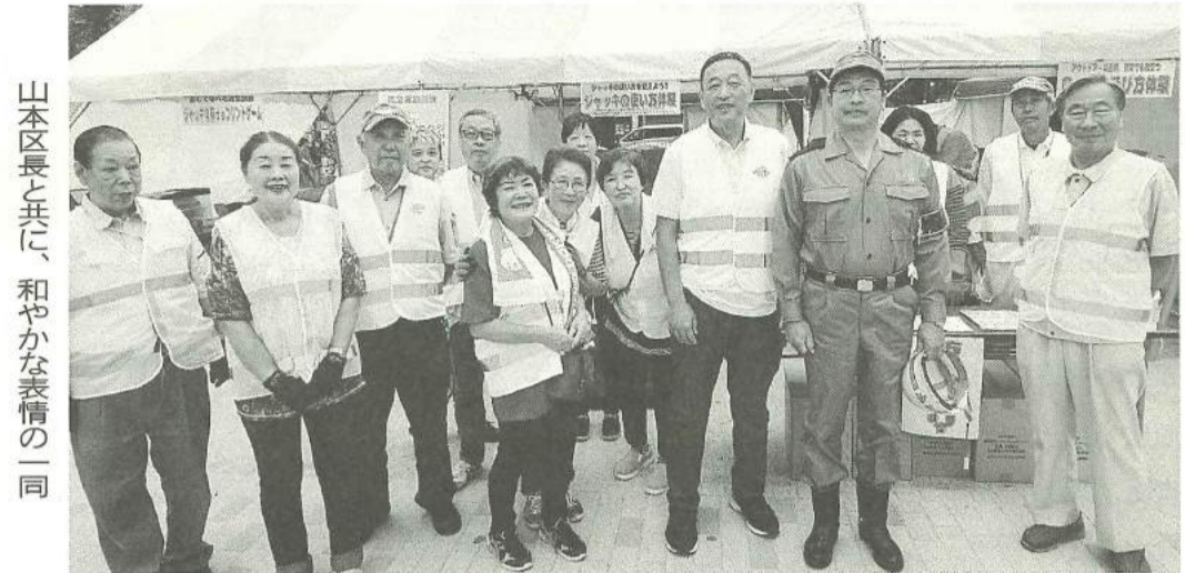
山本区長と共に、和やかな表情の一同