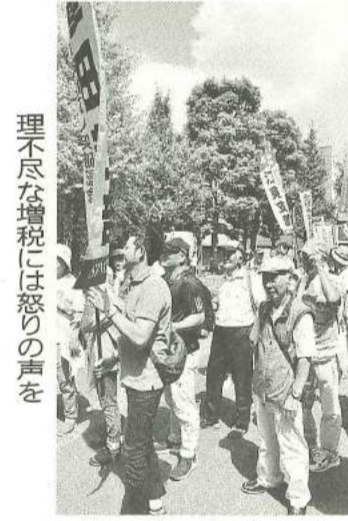
炎天下でも力強く行進