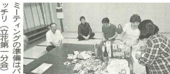
ミーティングの準備はバッチリ（立花第一分会）