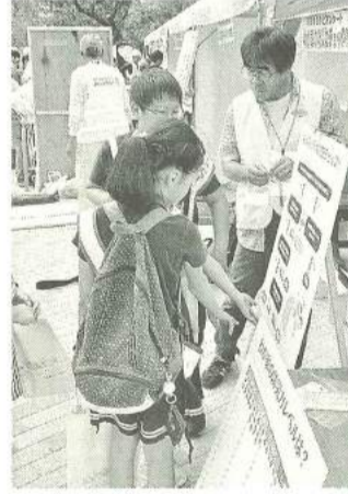
防災力をチェック。わが家は大丈夫かな…