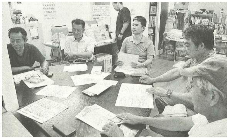
いつになく真剣な表情（あづま分会）

秋の仲間づくり月間もニケーションを図っている需要があります。何より、組合員同士で培ってきた顔の見える関係により、新たな仲間を募集するきっかけが見つかり、事業所の従業員として加入する層が増え、そういった新加入者へのアプローチの方法も分会によって様々です。建設業のカタチが変わっても、組合の根本的な部分はそう変わりはず、「仲間」とのつながり「に帰結するのではないかと感じますし、皆さんも同じように感じていただいていると思っております。期間中とても大変だと存じていますが、それでも協力してくださる仲間のためにも、組合をより良くするための仲間づくり月間、最後まで奮闘したいと思っておりますので、何卒よろしくお願い申し上げます。