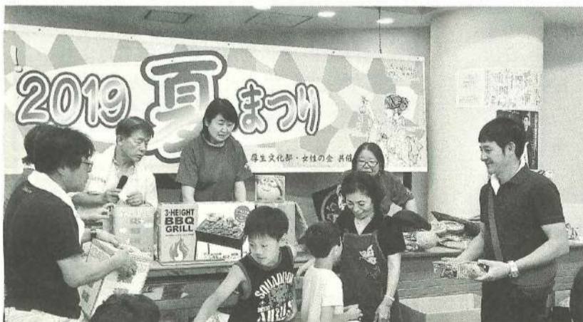
抽選会で大盛り上りの夏まつり