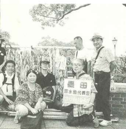
代表団、折り鶴の前にて

の言葉に「この宇宙と、海は、特定の国のものでは決して無い」とあり、本当にその通りだと思えました。もう一つ、「長崎1945アンセラスの鐘」を鑑賞。爆心地に近い浦上第一病院、自ら被災者がとうとうと快く書いて来た欲しいと思いま