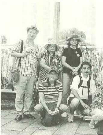
墨田原水協代表団