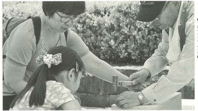
熟練の釘打ちテクにクギツケ 【立花第一分会】