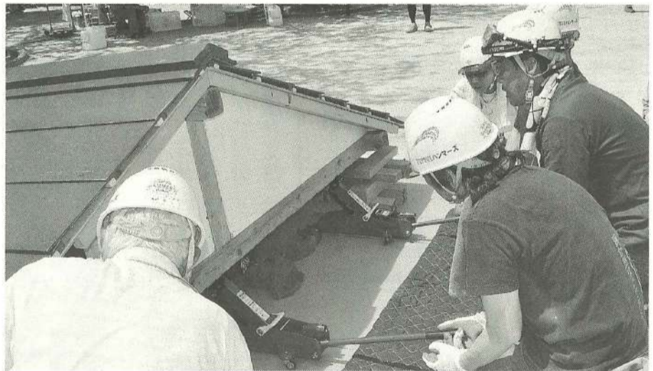
本番さながらの緊張感で行う救助体験【ハンマーズ】

晴天に恵まれた5月19日(日)、後継者対策部... 青年部共催のバスハイクが開催されました。千... 葉県牛込海岸潮干狩り場... から、「漁師料理かなや」... で海鮮バーベキュー食べ... 放題、野菜詰め放題もつ... いて盛りだくさんの一日... となった同イベントは、... 募集開始からあつという... 間に定員の50人が埋ま... てしまふ反響を見せまし... た。袋一杯のアサリを手... にピースサインを見せる