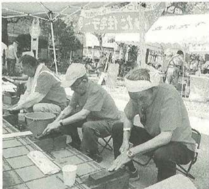
真剣な眼差しは、包丁よりも鋭い 【立花第二分会】

※2018年度より対象になっている方には、国保組合よりご案内が送付されます。届出が遅れた場合、9月以降の適用となりますのでご注意ください。お問い合わせは支部事務所まで 03-3614-3806