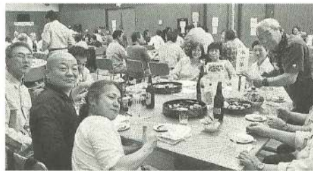
大逆転達成の本所第二分会

となり、本所第二・八広・あづま・ひきふね・墨田・直属の各分会が目標を達成しました。また、青年部・女性の会・シニア友の会、建設業で働く人たちのほとんど全てが東京土建の加入対象者です。気がついたら皆で声をかけ、日々仲間を増やしていきましよう。労働組合にとって、人数は大きな力です。普段あまり参加できていない組合員さんがいらっしゃるようでしたら、是非とも気軽にご参加ください。拡大以外にも、飲み会やバスハイク、様々なレクリエーションをご用意しております。