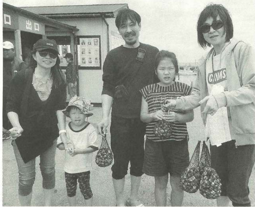
大量のアサリにニコリ。食べきれんかしら...

もと、血圧や体脂肪測定... ナーも設け盛況でした。... 舟原公園では、20代の... 青年部員が4人参加し、... 1人はかき氷、3人が包... 丁研ぎを担当する様子が... 同え、近年なかった光景... だ」という感想を他の... 参加組合員からいただき