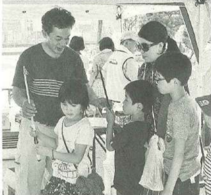
防災企画は大行列 【本所第二分会】

求に成功している手応えを感じられました。また、従来の違った客層の確保に繋げることができました。ルーティンのように成功している手応えを感じられました。また、従来の違った客層の確保に繋げることができました。