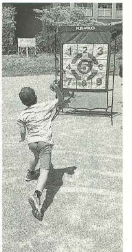
ナイスピッチング! いいフォーム【黒田分会】