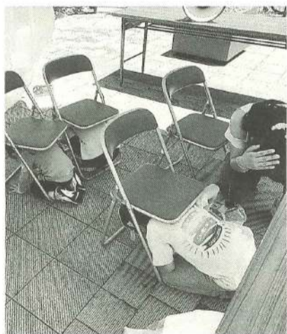
シェイクアウトの様子

6月16日(日)京島3丁目の防災広場にて、京島の2町会合同で「炊き出し体験」が行われ、東京土建墨田支部からも地元ひきふね分会の皆さんと、立花第一分会とハンマーズのメンバーが参加しました。炊き出し体験は、「頭を守って！」「動かないで！」といった指示に従って地震発生をイメージして身の安全を守る方法をしっかりと学び、地域の皆さんに伝えるといったもので、小さいお子さんからお年寄りまで楽しみながら体験していただきました。