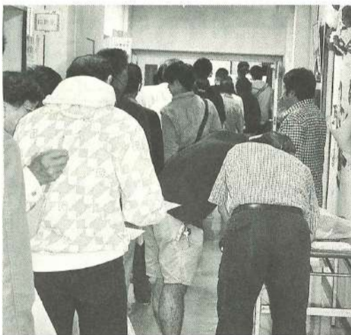
大行列！集団健診の需要はすごい

今回も墨田区報に掲載後、社会福祉協議会と東京土建墨田支部へ事前にお申し込みがありました55件のお宅へ施工。当日は手すりの施工以外に、今年も盛況 集団健康診断を行いました。日曜日の午前中に近くの会場を受診できることから、平日は仕事で健診を受診できない組合員や家族から好評で、事業所でまとめて受診しました。