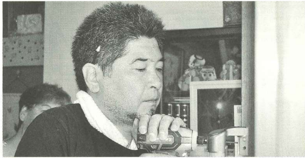
真剣な表情は確かな技術の裏づけ

■問い合わせ 東京土建墨田支部 仕事対策部 長妻 TEL 03-3614-3806