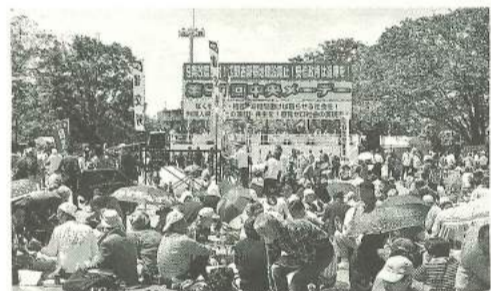
会場は参加者の熱気に溢れていた

5月1日(水)第90回中央メーデーが代々木公園で開催され、全体で2万5千人の参加があり、「働くものの団結で生活と権利を守り、平和と民主主義、中立の日本をめざそう」をスローガンに掲げ取り組まれました。 メーデーは、1日12時から14時間労働が当たり前の1886年。アメリカのシカゴを中心に、8時間労働を求めて、「第1の8時間は仕事のために、第2の8時間