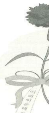
【あづま・06群】今月の協力してもらいたいと思