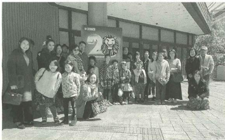
劇場にて開演前に記念撮影

【青年部・担当書記・三上電】3月24日(日)墨田支部青年部主催で、「劇団四季ライオンキング観劇会」を開催しました。毎年恒例だったこの企画ですが、今回は墨田支部60周年の記念行事として行いました。組合員さん達への感謝を込めた大特価のご案内としたところ、募集開始から一週間で40人の定員が埋まってしまいました。世界中で愛されてきたディズニー作品の「ライオンキング」を原作としたこのミュージカルは、日本でも多くのファンを有する超ロングラン作品であり、あの「心配ないさー」を生で観ることができるのは、この作品の大きな醍醐味です。初めての人も二度目の人もそれ以上の人もみな、壮大な王国の物語に心震え奪われる、代え難いひとときとなりました。この企画は、ミュージカルを通して非日常に触れてほしい、そして芸術作品に触れることにより文化的な活動の啓発に繋がればという目的で開催しています。今後も新たな文化活動をご提案していきたい所存です。