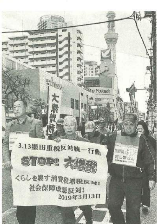
消費税増税反対を訴えてデモ行進

3月13日(水)すみだ 女性センターにて「重税 反対墨田統一行動」が開 催、東京土建墨田支部か ら22名が参加しました。 安倍政権は、今年10月 に消費税10%への引き上 げと軽減税率の導入を掲 げ、さらに問題なのは、こ の軽減税率とセットにし て、発行できない免税業 者からの仕入れは免税で ず、取引から排除され 倒産業者が続出する恐れ があります。私たちにで きることは消費税増税・ インボイス導入反対の声 を大きくして世論を動か していくことです。 集会後は、向島と本所 税務署に分かれてデモ行 進をおこない、確定申告 書の提出をしました。職 人、家内工業の多い、墨 田区にとって消費税増税 は死活問題です。「消費 税率10%は断固許さない ぞ」、「大企業の優遇税 制反対」、「社会保障制 度を拡充しよう」と怒り のシュプレヒコールを響 かせながら、税務署まで 行進しました。