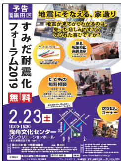
『耐震化フォーラム』チラシ