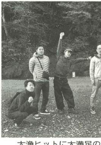
大漁ヒットに大満足の青年部員

【立花第二・17群】暑かった夏の日差しから一転、寒さが年寄りにはこたえます。皆さんも体調管理に気をつけてください。