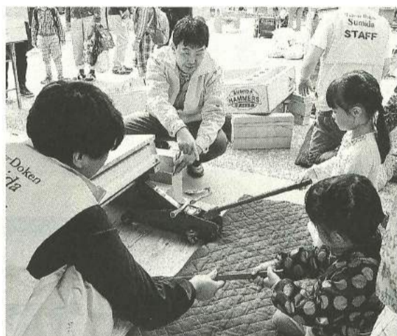
楽しく学ぶ防災コーナー

の熱い気持ちが伝わってなのか雨脚が徐々に弱まってきて、開会式には晴れ間も見える程に天気も回復して会場は約5,600人の来場者で溢れかかりました。 多様な企画通じて 地元建設組合をアピール 多くの来場者に地元建設労働組合東京土建墨田支部を「もっと知ってもらおう」と模擬店や体験コーナーなどの様々な企画も充実、一日楽しんでもらえるように実行委員会を中心に準備をしてき