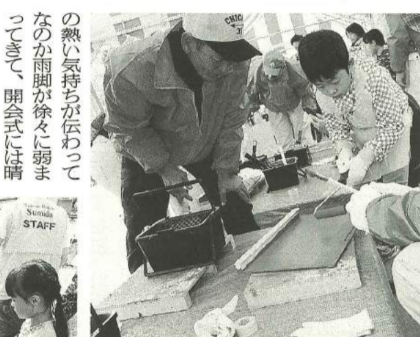
黒板づくりに熱中