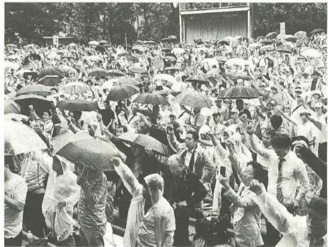
雨にも負けず、頑張ろう

7月5日(木)来年度の建設国保予算要求行動を実施し、墨田支部からは44人が参加しました。午前都庁前にて、「全都建設労働者対都要求行動」を、午後からは場所を日比谷公園に移して、中央決起集会を開催。集会当日はあいにくの雨模様でしたが「建設国保の育成・強化、現場労働者の賃金大幅引き上げを勝ち取ろう!」をスローガンにおこなわれ、全国から3,791人の仲間が集まりました。そして、公契約条例の制定、ハガキ要請や国会議員要