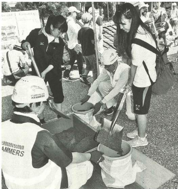
墨田区総合防災訓練

墨田支部は区民との信頼関係を前提とした活動、行政との連携を続け、5月27日(日)又は6月3日(日)に開催、第22回手すり取り付けボランティアは6月17日(日)実施、第28回すみだ住宅まつりは10月14日(日)に開催します。これら支部行事は地域支援策や災害対策上の課題、第4次地域建設産業振興計画への波及を踏まえた取り組みとします。