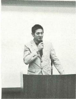
秋の学習会での拡大の訴え