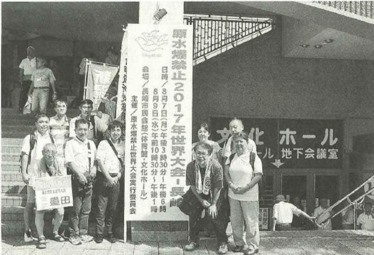
原水爆禁止世界大会長崎

2017年度の支部財政は分会・群の納入率向上の働きかけと定着性のある組織拡大による組織実増、新たな担い手づくりを目指した多種多様な取り組みの結果、17年度決算報告書とおりの繰越金となりました。 他方大きな支出を伴う支部会館の修繕については、修繕委員会の開催により、内容を把握し作成した長期修繕計画に基づき、エレベーターの耐震性、ガラス破損に伴う改修並びに付帯工事、関連して発注の方法などを議論し、都度執行委員会を確認しました。その結果17年度はエレベーター交換工事を8月、ガラス交換を始めとした外装工事を11月からとしました。エ