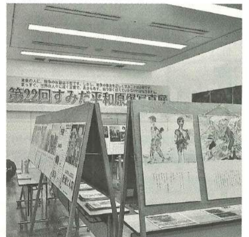
第22回すみだ平和原爆写真展

新たな担い手探しに向け、単年度の財政措置として継続した分会活動援助金について、全分会で計画と実践を目指します。18年度も修繕に関する支出を会館修繕引当金から行います。修繕内容については、支部会館長