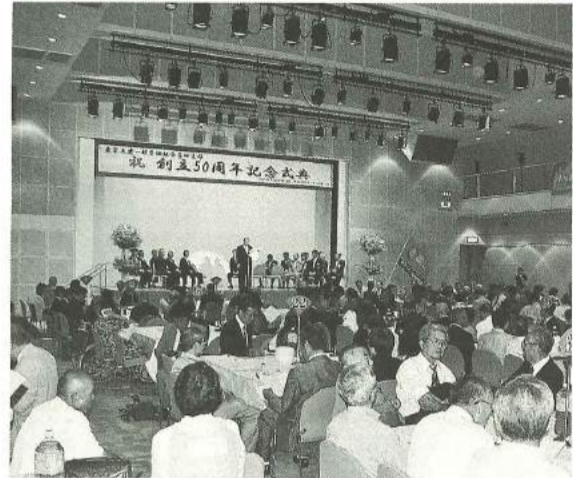
支部50周年記念式典

後継者・担い手育成問題は建設業では特に深刻ですが、中小企業の事業承継は国家的な問題として浮上っています。中小企業庁は17年版「小規模企業白書」において小規模事業者は「我が国経済の中で非常に重要な地位を占めている」と評価しています。事業者数の減少が続く、1986年の約477万者をピークに28年間で325万者32%減少しました。新規開業者以上に倒産・廃業者が多く、地域住民の生活を支える商店や工場、工務店がなくなり、地域雇用・就業機会が縮小してきました。第4次地域建設産業振興計画作成の目的に通じる内容です。