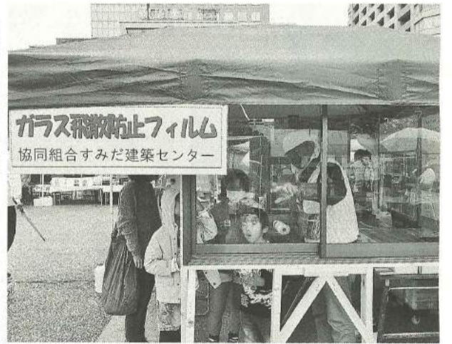
住宅まつりでのガラスフィルム体験

墨田区によれば、無料相談・耐震診断助成・耐震改修助成の申請件数は、東日本大震災や熊本地震後に一時的な増加が見られたものの、その後徐々に件数は減る状況が繰り返されています。また家具転倒防止・ガラス飛散防止についても、申請件数は減少傾向です。17年度は、相談後の最