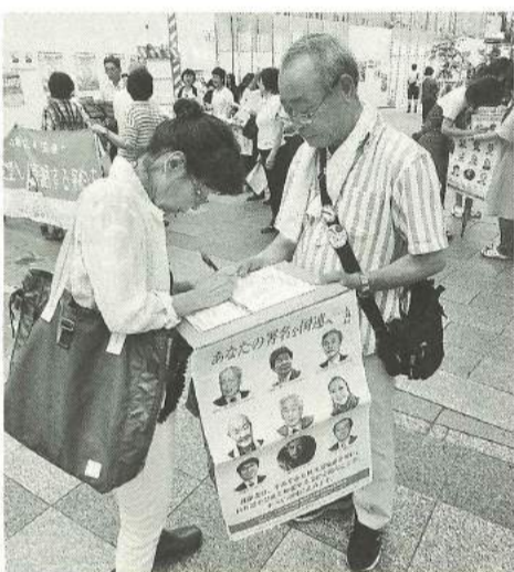
長崎での国際署名行動