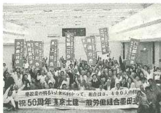
07年春の拡大打式での集合写真