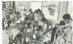
キラキラ茶家夜市