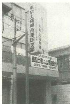
80年押上3丁目に建設した支部会館