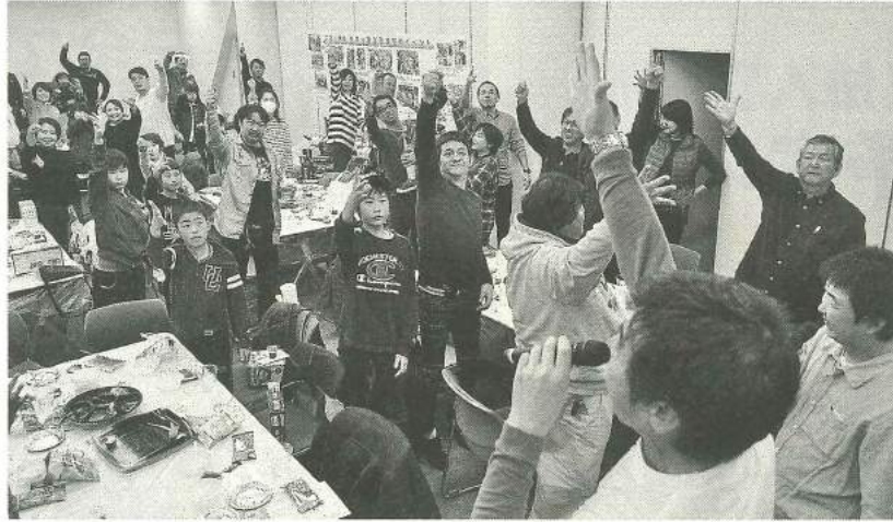
闘志むき出しのジャンケン大会

申請書（土建の事務所にあります）に記入・捺印の上、領収書（原本）・接種済証明書（原本）など接種したことが分かる書類を添付して、土建の事務所に提出