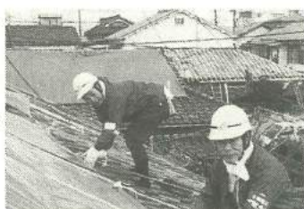
95年震災ボランティア派遣