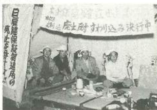
区役所前座り込み行動