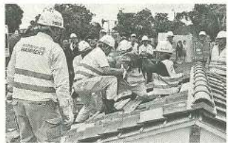
ハンマーズ救出訓練