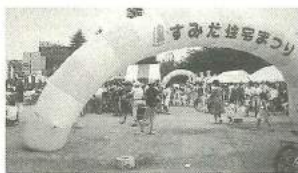
第1回すみだ住宅まつり