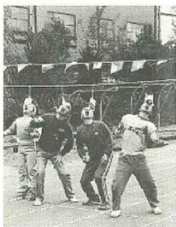
分会対抗で勝敗を競った運動会