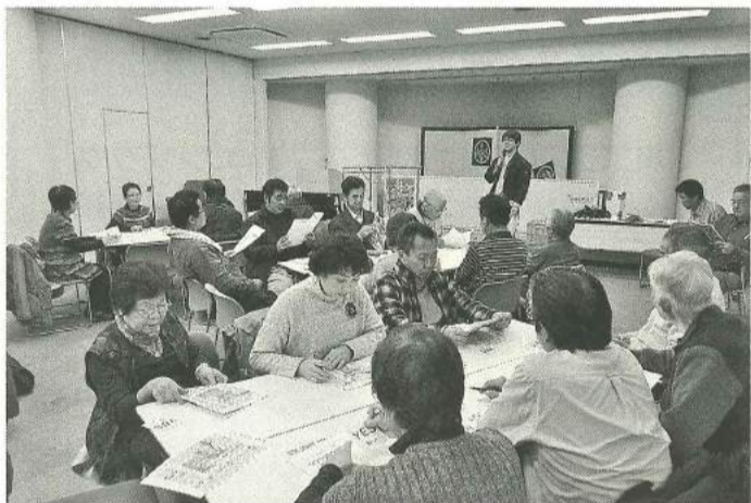
災害時に備えて楽しく学習

防災組織ハンマーズの登録者、支部役員、分会役員、女性の会役員を対象にして、この間の活動報告と、災害時に起こり得る様々なシミュレーションを設問にした「防災ゲーム」をおこないました。過去の震災の教訓をもとに、災害時に様々な状況から起こり得る設問にどう対応するかを回答していく防災ゲームを各テーブルに別れておこない、参加者で意見交換をしました。最初はみんな困惑しながらも災害時の対応を自らの問題として考え、その課題に対し、自分の意見を伝え、他者