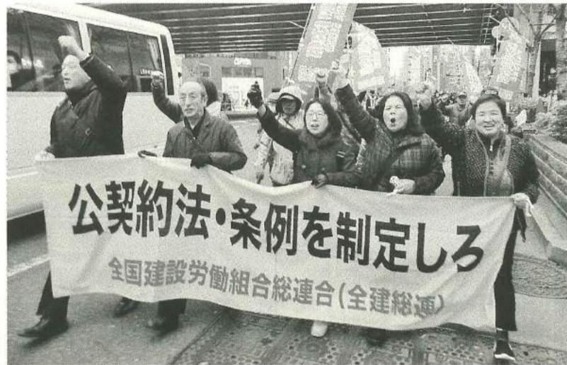
予算実現に向けて「ガンバろう！」

11月22日(水)予算要求集会を開催しました。午前中は都庁前の新宿中央公園にて「全都建設労働者対都要求行動」として