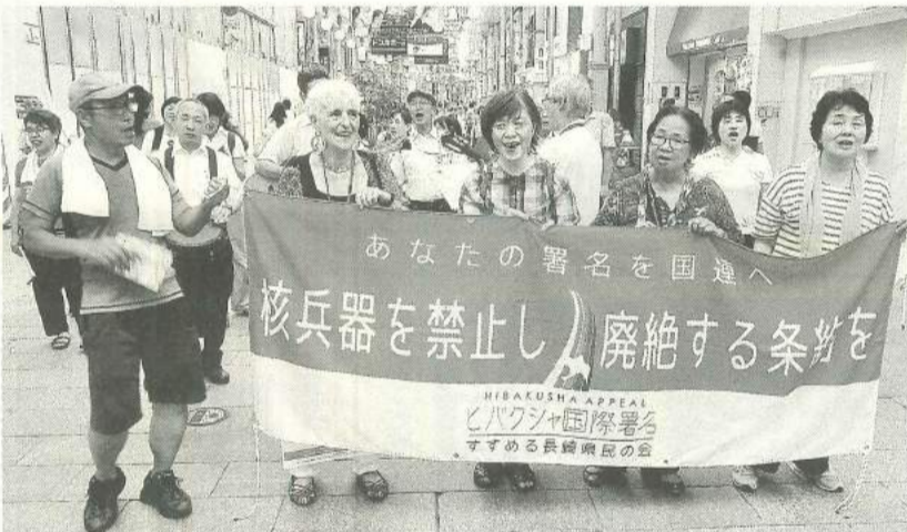
長崎での『ヒバクシャ国際署名』行動