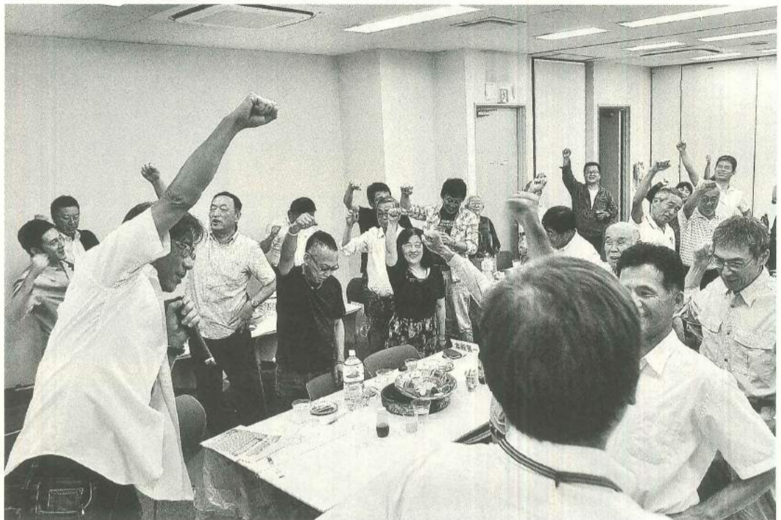
目標達成をめざして「団結して頑張ろう！」