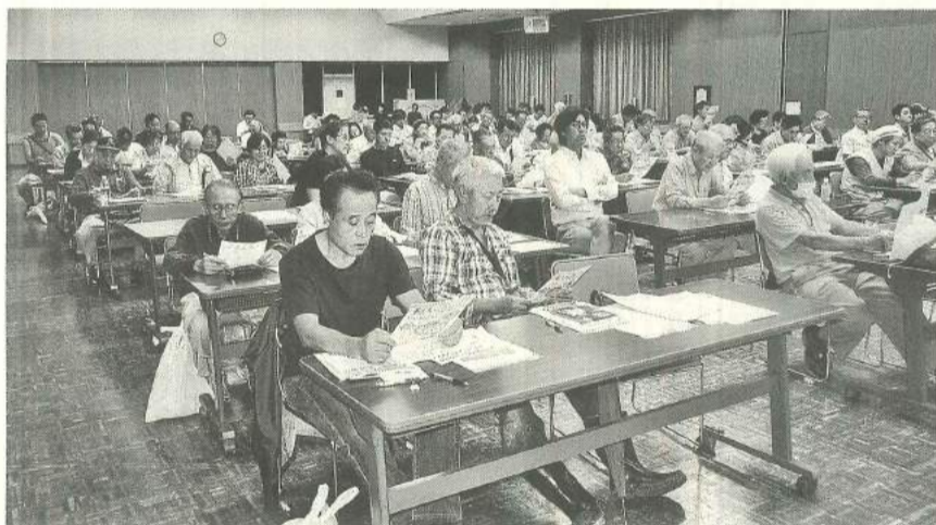
みんな講演に集中

「自主防災組織ハンマーズ」、「墨田支部ゴルフ部第17回コンペ」などの様々な訴えや告知が聞こえました。学習制度は、今後とも支部・分会役員を対象にした学習会を定期的に開催してまいります。