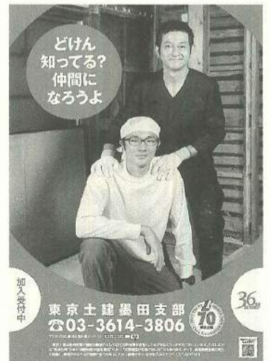
今年の秋の拡大ポスター

拡大月間を成功させるためには、みなさんの協力が必要です。拡大行動には、お話しを聞かせてください。お宅に、お伺いすることもあると思います。その際には、知り合いに組合員を勧誘していただきます。