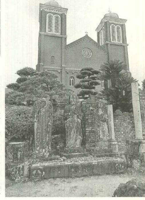
爆心地から約500mの浦上天堂

す。その他にも、建物耐震相談や住まい相談なども用意しています。 ご家族・ご近所・ご友人の方にも声をかけ、多く地域の方に会場にいらして下さるようお願いいたします。