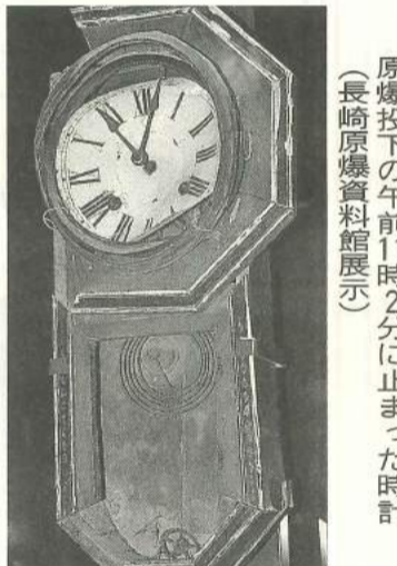
原爆投下の午前11時2分に止まった時計 (長崎原爆資料館展示)