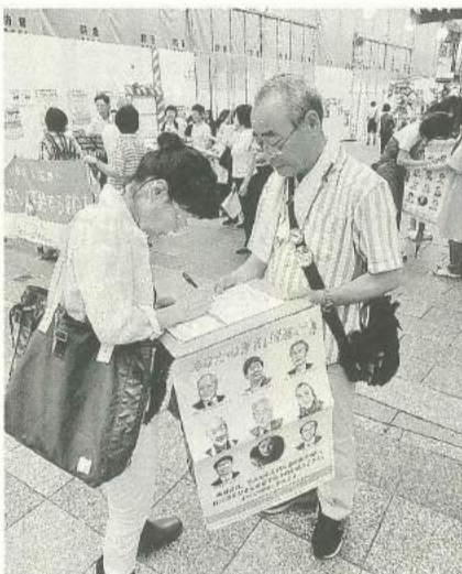
長崎での『ヒバクシャ国際署名』行動