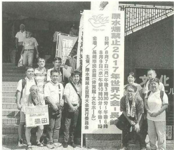
墨田原水協代表団のみなさん