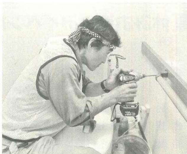
今年も一本一本丁寧に施工

6月25日(日)に墨田区内の65歳以上の高齢者宅を対象に実施している手すり取付ボランティアをおこないました。今年で21回目となったこの取り組みは、地域に責任を持った業者・組合であることをアピールし、高齢者の住宅要求や悩みを解決し、住み続けられるまちづくりをめざして、これまでに手すりを取り付けた区内高齢者宅は、1804件となりました。今年も墨田区報に掲載がとつてまいりました。