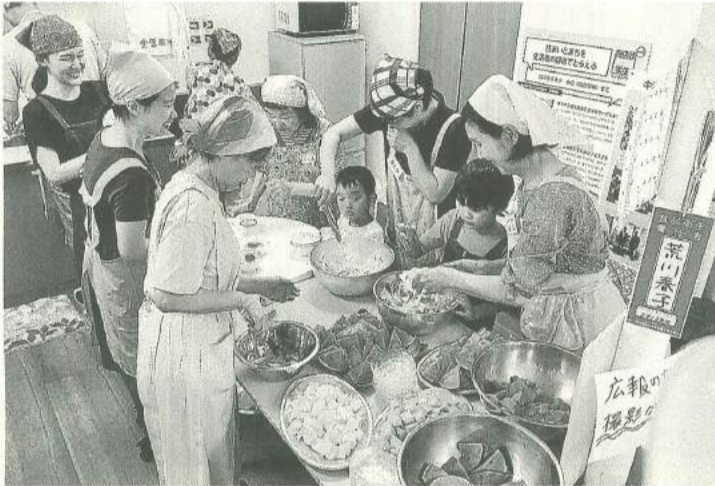
お年寄りから子どもまでみんなで作ります

東京土建墨田支部が中 NPO法人すみださわやかネット。そのさわやかな心となって活動している