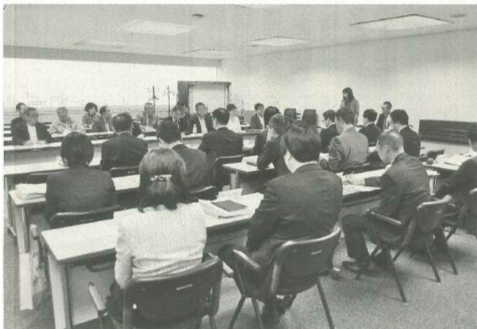
墨田区への要請行動

④4月以降も社会保険適用促進へ 国交省は昨年7月28日、社会保険加入に関する下請指導ガイドラインを改定しました。改定は、法定福利費を内訳明示した見積書の活用徹底が大きなポイントです。1次下請企業が内訳明示の見積書を提出するよう2次下請企業に働きかけるとともに、雇用する労働者や2次下請企業の法定福