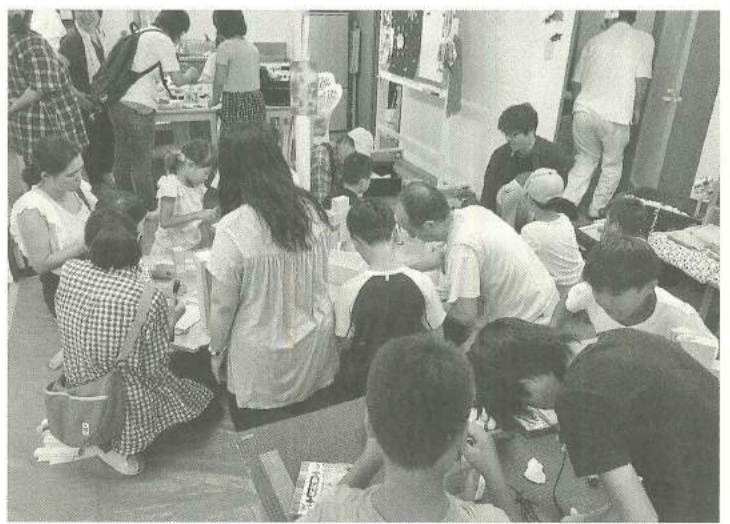
キラキラ茶家の夏休み木工教室

自覚的な学習と様々な団体との交流により鍛え上げられた組織として、活動についての調査結果です。また国交省も災害時の発生時にその持っている力を発揮する存在として、居る市町村支援の強化策として、民間の技術者・組織を効果的に活用し、市町村の災害対応力を補うと期待は大きくなっています。総合防災訓練