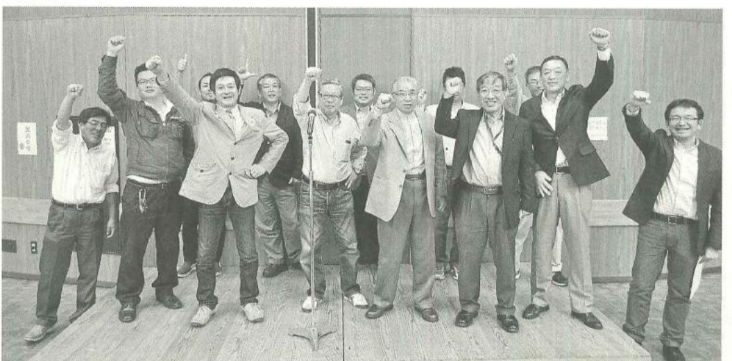
組織増勢に向けて団結して「ガンバロウ」