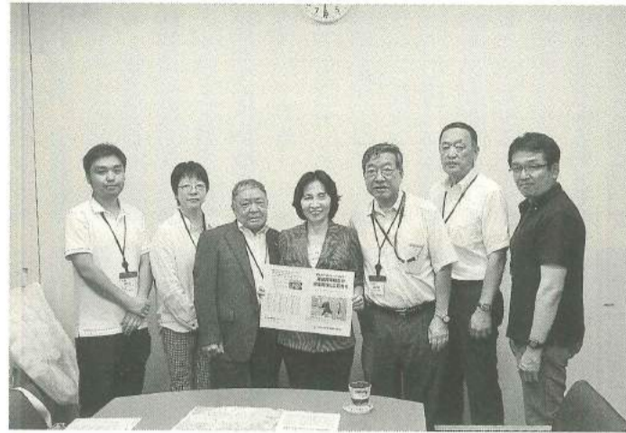
地元国会議員要請行動

②労働安全衛生の啓発促進 安全経費・工期・労働時間の確保など労働災害を根絶するためには、現場での啓発活動が重要になります。向島地区木造家屋等低層住宅建築工事