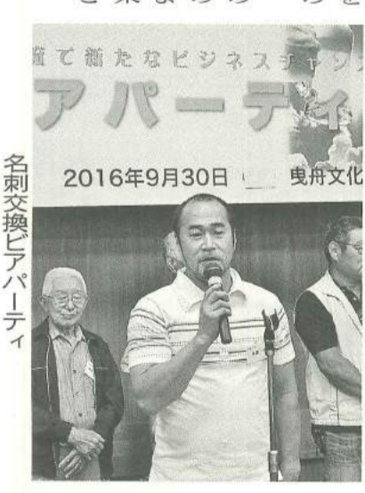
名刺交換ヒアリングパーティー

《足場の組み立て等作業主任者》講習日 4月11日〜12日の2日間 受講料 1万1千円 対象者 18歳以降の経験で3年以上の方 《不造建築物の組み立て等作業主任者》講習日 5月30日〜31日の2日間 受講料 1万1千円 対象者 経験3年以上の方