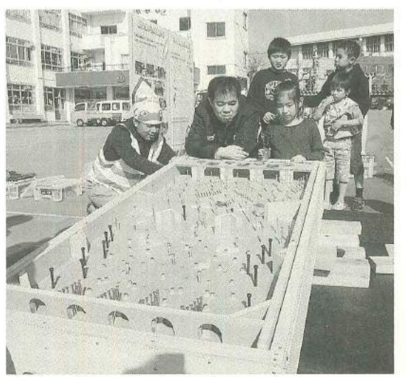
楽しく防災について学習