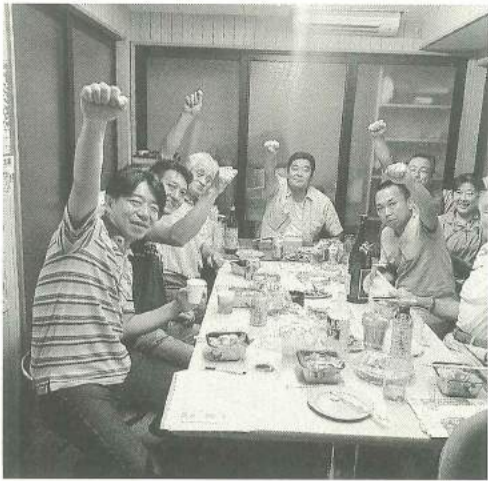
本所第一分会の拡大センター

17年1月組織人員は協... 会けんば移行脱退との綱... 引き、昨春の81人大量脱... 退、16年度就業実態調査... など組織をめぐる厳しい... 情勢のなか、2,840人... で迎えました。1月組織... 数を前年比マイナス31人... にとどめましたが、盤石... な2,900人支部実現... には届きませんでした。