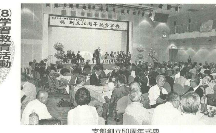
支部創立50周年式典