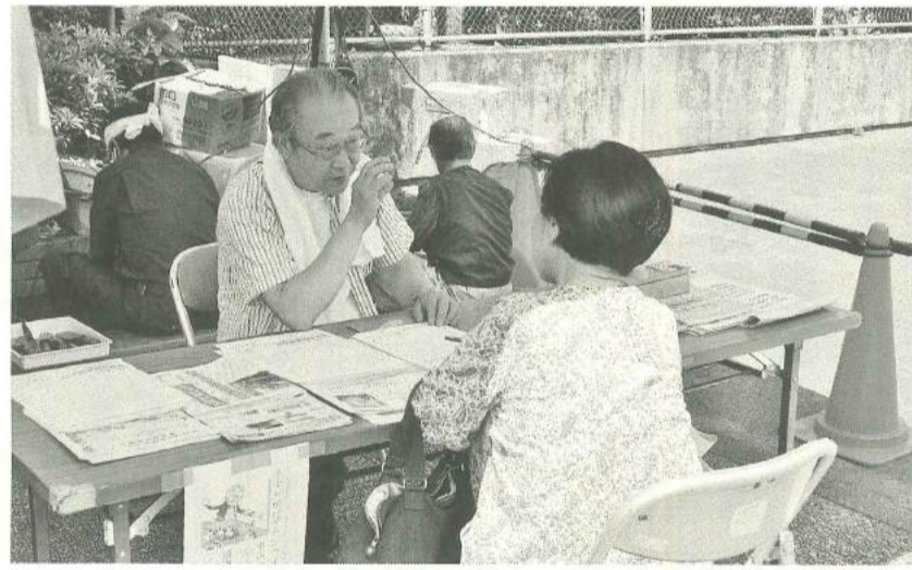
住宅デーでの建物相談

すみださわやかネットは墨田支部の地域展開で得た防災福祉コミュニティ形成の課題は、現在のキラキラ茶家です。前進しています。すみだ女性センターが発行する「すずかけ」、向島高齢者総合支援センター発行の冊子には、高齢者が気軽に立ち寄れる場所として紹介されています。