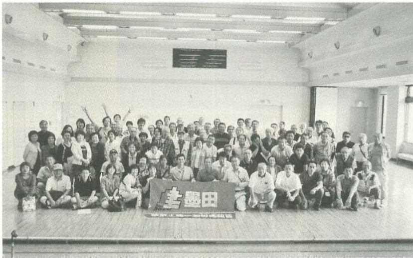
要求実現に向けて頑張ろう

以上が2017年度の 主な運動課題です。各分 野の取り組みと方針は、 専門部議案、分散分科会 で深めてください。今年 度の墨田支部の活動を豊 かなものにするため、活 発な論議をお願いします。