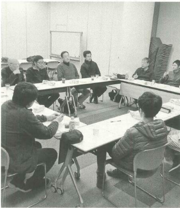
第4次建設産業振興計画準備会

区内中小建設従事者 田区は基本計画に基づが産業として育成強化さき、17年度に新住宅マスタープランを策定しまし題があります。一方で墨た。マスタープランの基