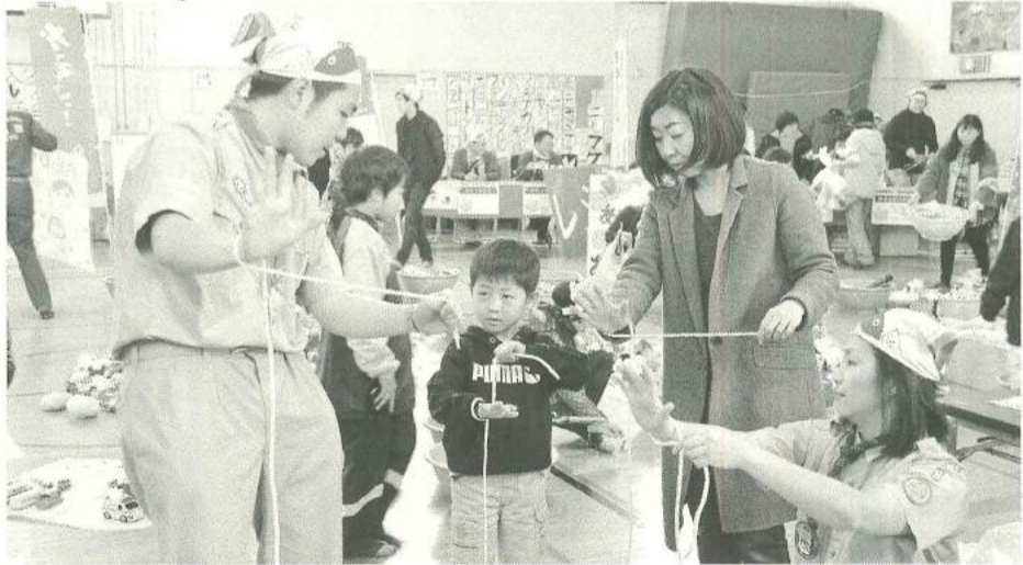
ロープの結び方「うまくできるかな?」

2月26日(日)墨田区 建墨田支部からは、自主 立第一寺島小学校と二寺 防災組織ハンマーズとN 言問集会所にて「イザ! PO法人すみださわやか カエルキャラバン! in 寺 島」ネットを中心に8名が参 加しました。