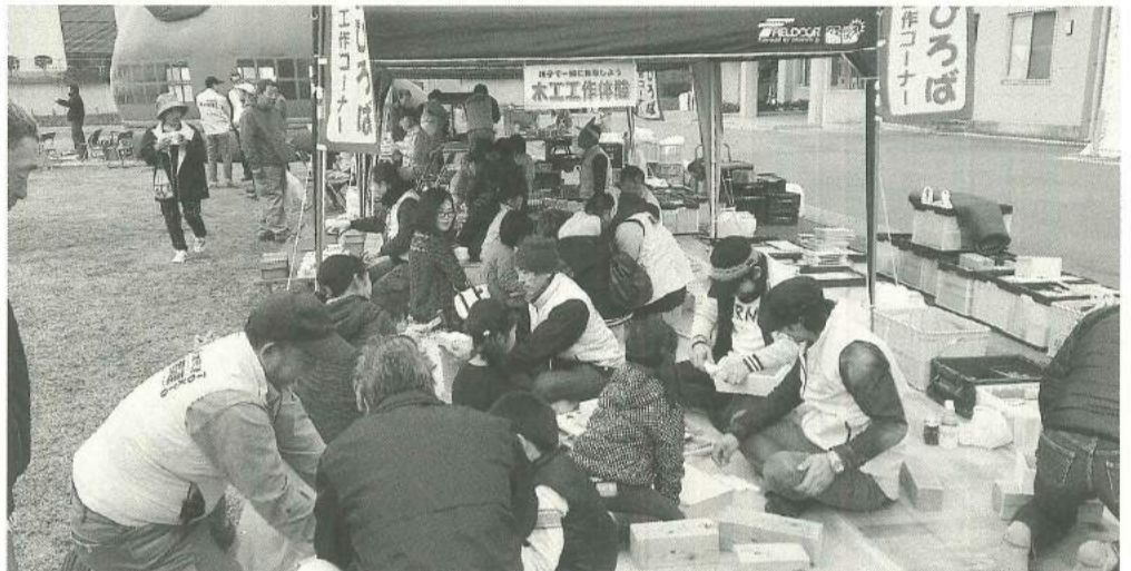
福島県「かわうち祭り」に参加

本目標は「誰もが安心して快適に住み続けられる、暮らしてみたいくなる」の「すみだ」の実現です。基本計画でうたわれた「暮らしたいまち・働きたいまち・訪れたいまち」の内容が具体化されています。新住宅マスタープランでは快適な住環境を提供する担い手として耐震協などがあげられています。構成団体である墨田支部を含めた中小建設従事者への期待が込められています。新住宅マスタープランの具体化は、地域建設産業確立を目指す第4次地域建設産業振興計画と密接な関係を持つこととなります。