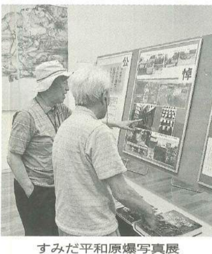
すみだ平和原爆写真展