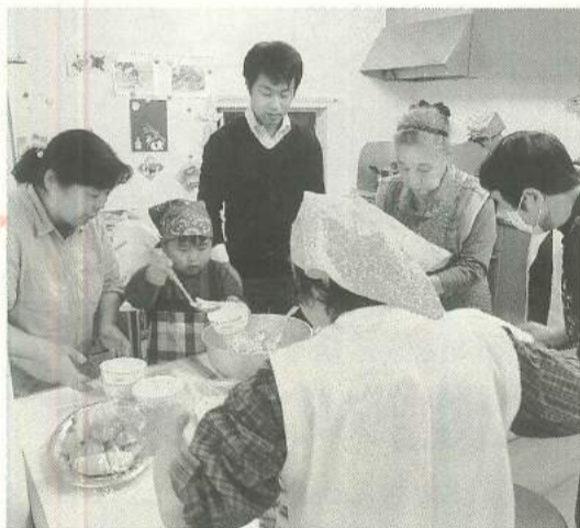
調理もみんなで担当

参加者が食事するものは、短時間で作りやすく、誰もが食べやすいものとなっていて、午後4時30分からスタート、買い出しから調理、食事、その後片付けをし、互いに交流できる環境となっています。