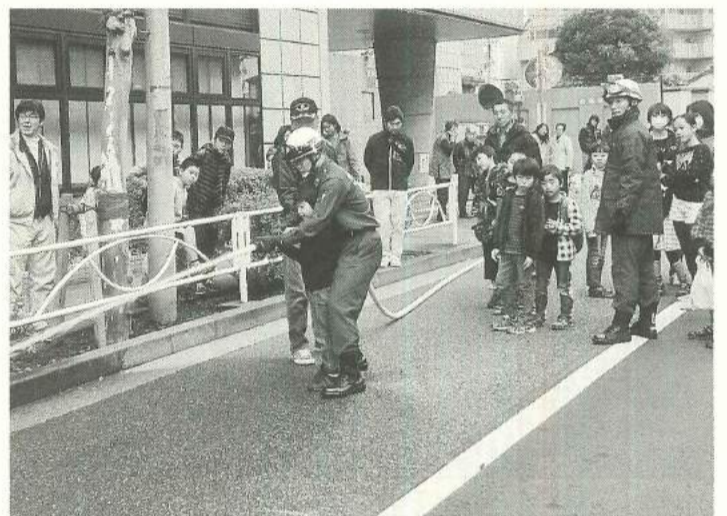
スタンドパイプをつかった初期消火訓練

11月27日(日) 墨田区特別老人ホームの業平ホームで業平5丁目南町会の防災訓練がおこなわれ、町会役員・婦人部・消防団の皆さん、本所消防署職員の方々、東京土建墨田支部のハンマーズを含め総勢50名の参加がありました。