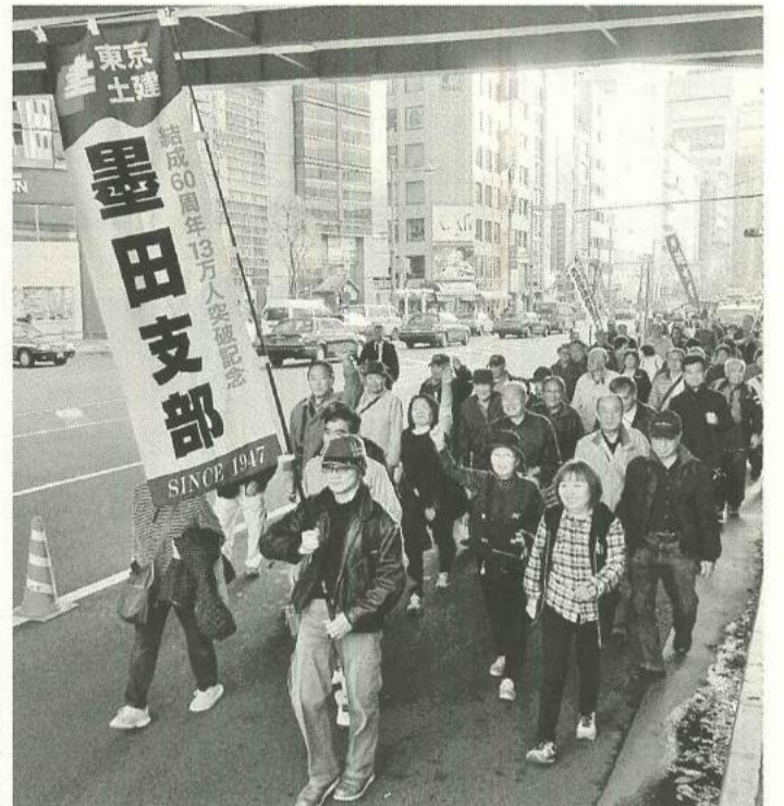
東京駅まで元気にデモ行進

大会決議では「建設国保は私たちの先人が作りあげた建設労働者・職人の命の綱。私たちの要求は、日本の建設産業を持続させるうえで必要不可欠なものばかり。全国の建設労働者・職人の仲間が全建連連に結果として、自らの仕事と暮らしを変えていこう」と確認が