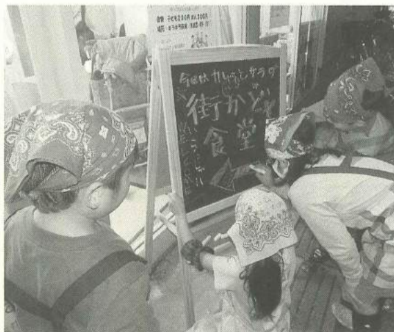
看板を装飾して宣伝

申請書(土建の事務所にあります)に記入・捺印の上、領収書(原本)・接種済証明書(原本)など接種したことが分かる書類を添付して、土建の事務所に提出