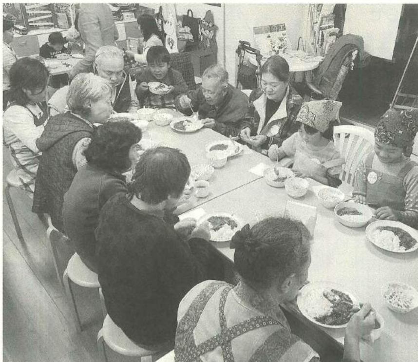
大勢で仲良く「いただきます」