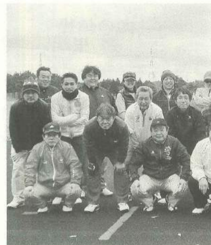
みなさんの参加をお待ちしています

用した簡易担架作りをおこない、参加した方たちにも実際に体験してもらいました。その後、会場前の道路にて各町会防災倉庫に配備してある、スタンドパイプを使用して初期消火の訓練をおこない、地元町会・消防団・本所消