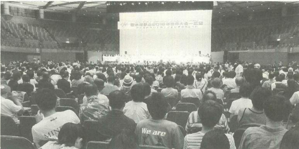
世界大会開会総会の会場

今年、広島に行けて貴重な時間を経験させて頂き、ありがとうございます。参加させて頂き本当に良かったです。