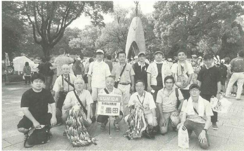
墨田原水協代表団のみなさん