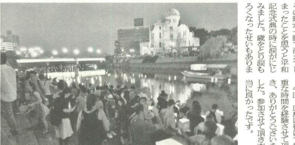
元安川で行われる「灯籠流し」