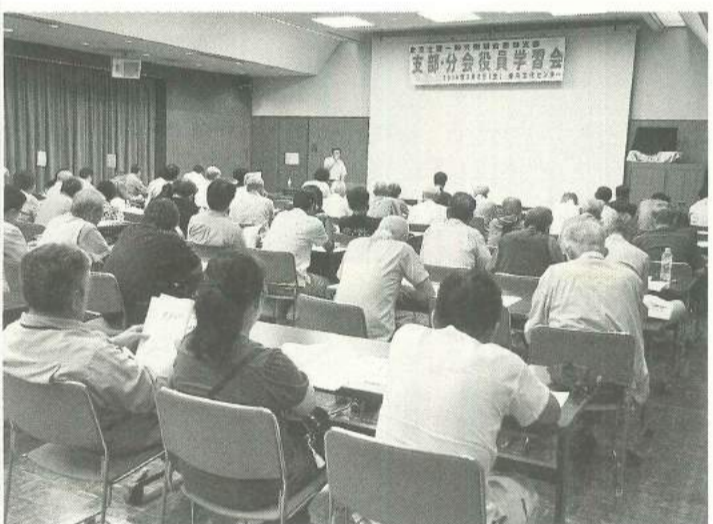
会場には多くの役員が集まりました

9月2日(金)曳舟文 化センターにて秋の役員 学習会を78名の参加おこ なしました。当日は、東 京土建本部の松浦書記を 講師に招き、アスベスト の特性から被害者の病 状、そして労災認定をテ ーマに「アスベストの歴 史から危険性と労働者救 済の戦い」についての講 演をして頂きました。参 加者からは「アスベスト の危険性について改めて 勉強することができて良 かった」、「老朽化によ り、これからアスベスト 含有建物を解体する機会 が多くなる、組合を通じ て講習会を定期的にお 催していただきます。