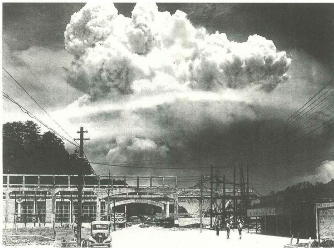
原爆投下直後に香焼町から撮影したきのこ雲

木から落ちた実をカーセ表すことが出来ないほどの生き地獄でした。街全体が焼け野原でそこらじゅうには人や馬の骨が転がっていて、凄く臭いがしていたのを覚えています。私は、その様子を見ることが出来なくて50cmほどの細い道から戻りましたが、どのようにして自宅まで帰ってきたかは未だに解りません。