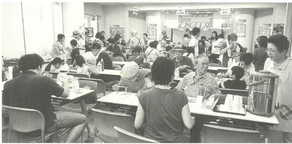
昨年を上回る来場者で大賑わい

この「夏まつり」とにかく一日楽しく満たされるイベントなのです。おまけにすべての企画が無料！『食べて・遊んで・書いて・作って・覚えて』