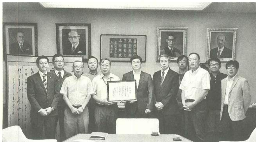
山本区長より表彰状を受け取る支部四役

そして、集会終了後は雨も上がり、東京駅周辺までデモ行進「建設国保を守れ」、「社会保険料を労働者に保障しろ」、「消費税増税反対」と大きな声を挙げ、元気よく歩きました。