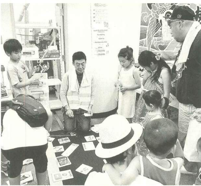
子どもから大人まで楽しく学んだ「釣りゲーム」

また、山形おきたま産直センターさんの採れたてのさくらんぼ・卵・きゅうり・トマト・インゲン等の新鮮野菜の販売ブース。復興支援の一環としておこなった三陸の昆布販売とキヌケヤさんによる東北のご当地ならではの物産販売も大盛況で「主婦や子どもたちが喜ぶ企画がたくさんあって楽しい一日を過ごすことができました」