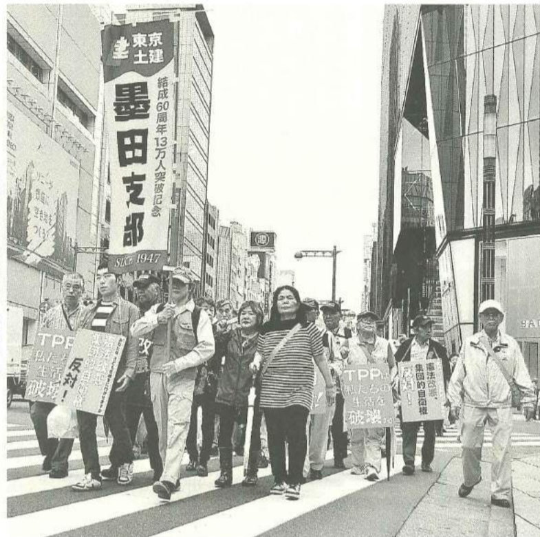
銀座のまちを元気よくデモ行進