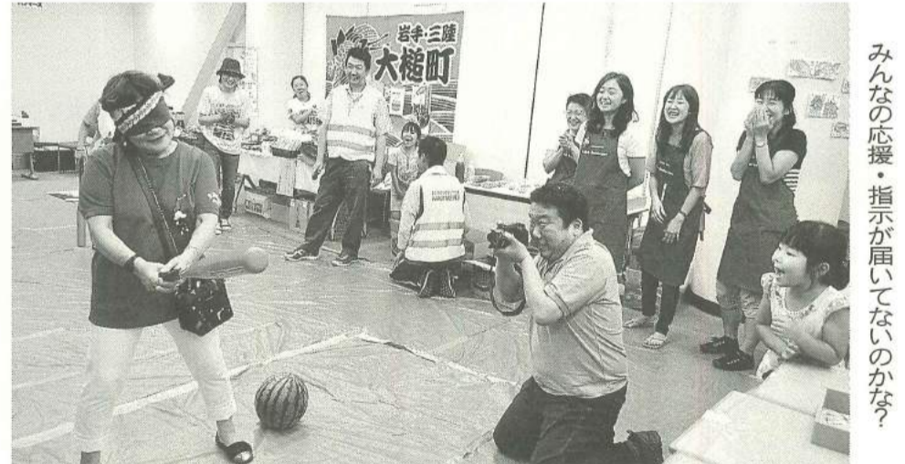
みんなの応援・指示が届いてないのかな？

「覚」は、ハンマースの方々の協力で災害時の必需品を大人から子どもまで楽しく遊びながら学べる「釣りゲーム」がおこなわれました。