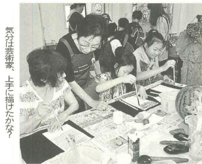
気分は芸術家、上手に描けたかな？

そして、メイン企画のスイカ割りでは、かわいなお子さんやお孫さんか暑い中、焼きそば・イカ焼き等のBBQ係に奮闘して頂いた東建産の方々。楽しく防災を学ぶ企画を運営してくれたハンマースの方々への協力を頂き、「夏まつり」を成功させることが出来ました。心より感謝しております。