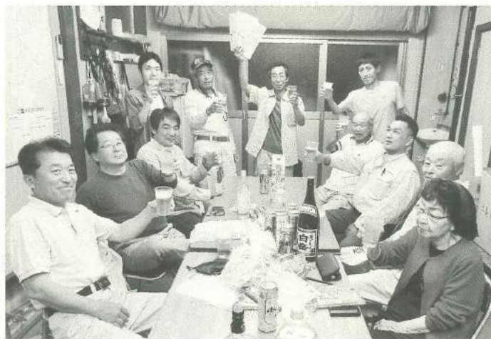
拡大センターでお待ちしています(あづま分会)