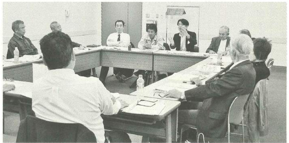
分散会では、多くの活発な意見がありました

4月10日(日)KFCホールにて、墨田支部第58回定期大会を開催し、来賓6人を含む122人が参加しました。