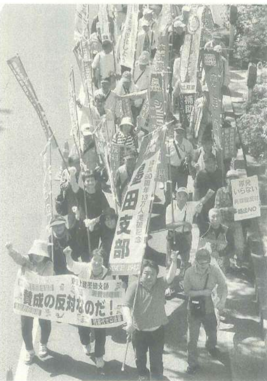
暑さに負けず、元気にデモ行進