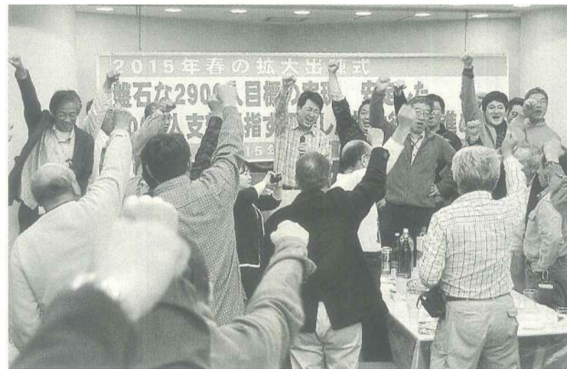
目標達成に向けてガンバろう!

新しい仲間を東京土建に迎え入れ 組合とともに仕事や暮らしの問題解決を 4月21日(火)支部会館において、72名の参加で春の拡大出陣式を開催。「盤石な2900人目標の実現、安定した3000人支部めざす団結した拡大行動を進めよう」をスローガンに掲げ、春の拡大(仲間を増やす)月間がスタートしました。