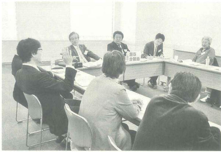
分散会では、有意義な意見交換

「誰もが安心して暮らすことのできる地域社会実現のため、建設産業と建設労働者の連携を推進する」というテーマで、建設労働者の権利の擁護と建設産業の発展を促進することを目的として開催された。大会では、各専門部の議案討議の他に、共通テーマとして、①地域支援と産業対策(分会住宅デー・手すり取り付けボランティア)②組織課題(群・分会の現状)についての議論がおこなわれました。①のテーマでは、「住宅デーでは、建設業をアピールする企画が不足している、例えばクロス補修、網戸張替の実演などをしてみたい」という声が多く聞かれた。また、「手すりは、女性がいると話しやすい、住民の方との会話が盛り上がり、仕事確保や東京土建のアピールにもなる」とのテーマでは、「若