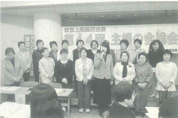
今年度も「明るく・楽しく・元気良く・そして美しく！」

年度の活動方針、予算提案、役員体制が満場一致で承認されました。 総会終了後は、懇親会 安全な農作物で私たち消費者の命と健康を守