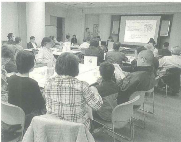
参加者は、みんな真剣に学習