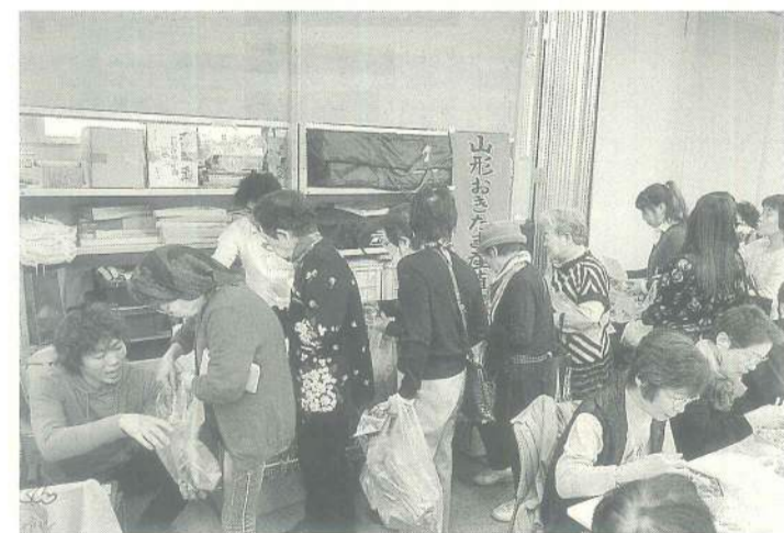
産直販売は大盛況ですぐに完売