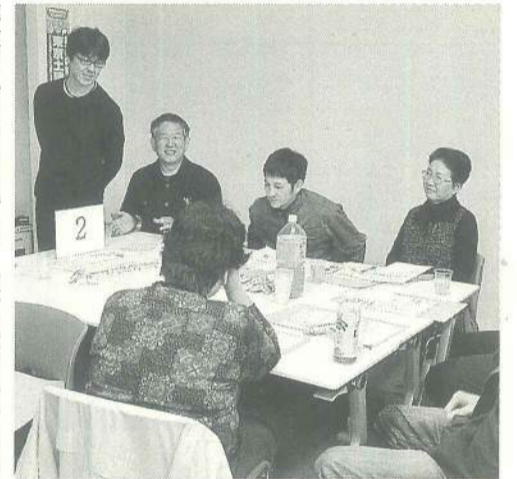
「防災ゲーム」では、みんなで見聞交換

ツシユ症候群」と、「トリアージ」について学習と災害時に起こり得る様々なシミュレーションを設けました。 「防災ゲーム」では、みんなで見聞交換