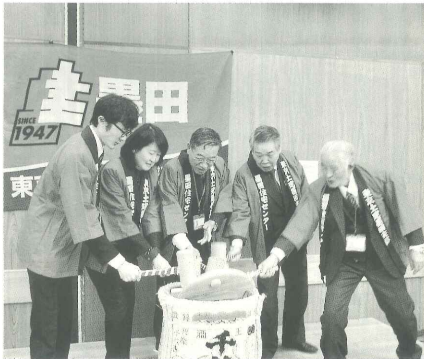
明るく・元気よく、「よいしょ」