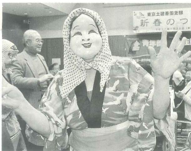
今年も来ました「常葉ひよっこ踊りの会」

鏡開きと乾杯後は、皆さんが毎年楽しみにしている余興です。今回も昨年に引き続き、福島県田村市での住宅デーでお世話になった「常葉ひよっこ踊りの会」の伝統芸能ひよっこ踊りです。今年も多めに衣装とお面