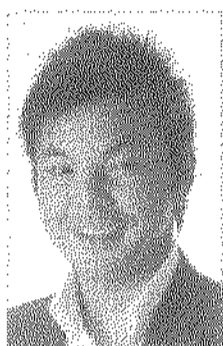
城 彰二 (じょう しょうじ) サッカー解説者/元日本代表FW

北海道出身、高校時代は鹿児島実業高等学校に在籍中、第72回高校サッカー選手権大会でベスト4入りを果たす。卒業後、Jリーグ・ジェフユナイテッド市原(現ジェフユナイテッド千葉)に入団。デビュー戦から4試合連続ゴールを挙げ、たちまち世間の注目を集める。2000年にはスペイン1部リーグのバリャドリードへレンタル移籍、2得点を挙げるなど、レギュラーとしてチームに貢献。日本代表としても活躍し、96年アトランタ五輪・98年フランスW杯に出場。(国際Aマッチ35出場7得点)2006年12月に、13年間に渡る現役を引退。現在はサッカー解説者として活躍するほか、サッカー教室など後世育成活動に取り組んでいる。