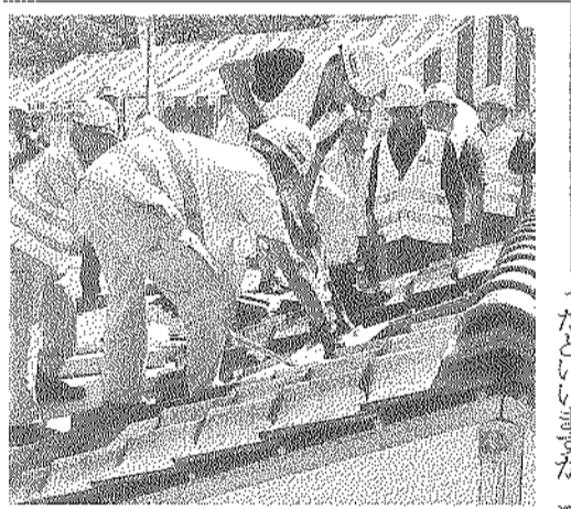
「ハンマーズ」による救助訓練

現在、墨田区には、老朽建物や空き家などに対する相談・苦情が37件寄せられており、調査対象になっている空き家は約100件あります。東京建設士事務所では、「空き家対策推進協議会」を通じて、防災まちづくりを進め、区民の皆さんの安全で安心な暮らしを守るため、この条例に基づき、危険な老朽建物等への対策・推進をしていきます。