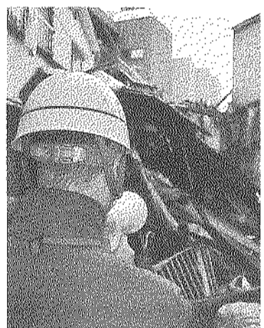
区危機管理担当安全支援課による「行政代執行宣言」

この条例では、老朽建物などの所有者等の管理義務や、適正な管理がなされていない場合の措置などを定めました。また、区内諸団体が構成する「空き家対策推進協議会」に、一般社団法人東京建設士事務所協会の墨田支部、墨田建設業協会、公益社団法人東京都宅地建物取引業協会墨田支部、一般財団法人墨田まちづくり公社、墨田区役所危機管理担当安全支援課、東京建設士事務所が幹事団体として参加し、倒壊や放火などにつながる恐れのある老朽建物等への対策強化をはかっています。