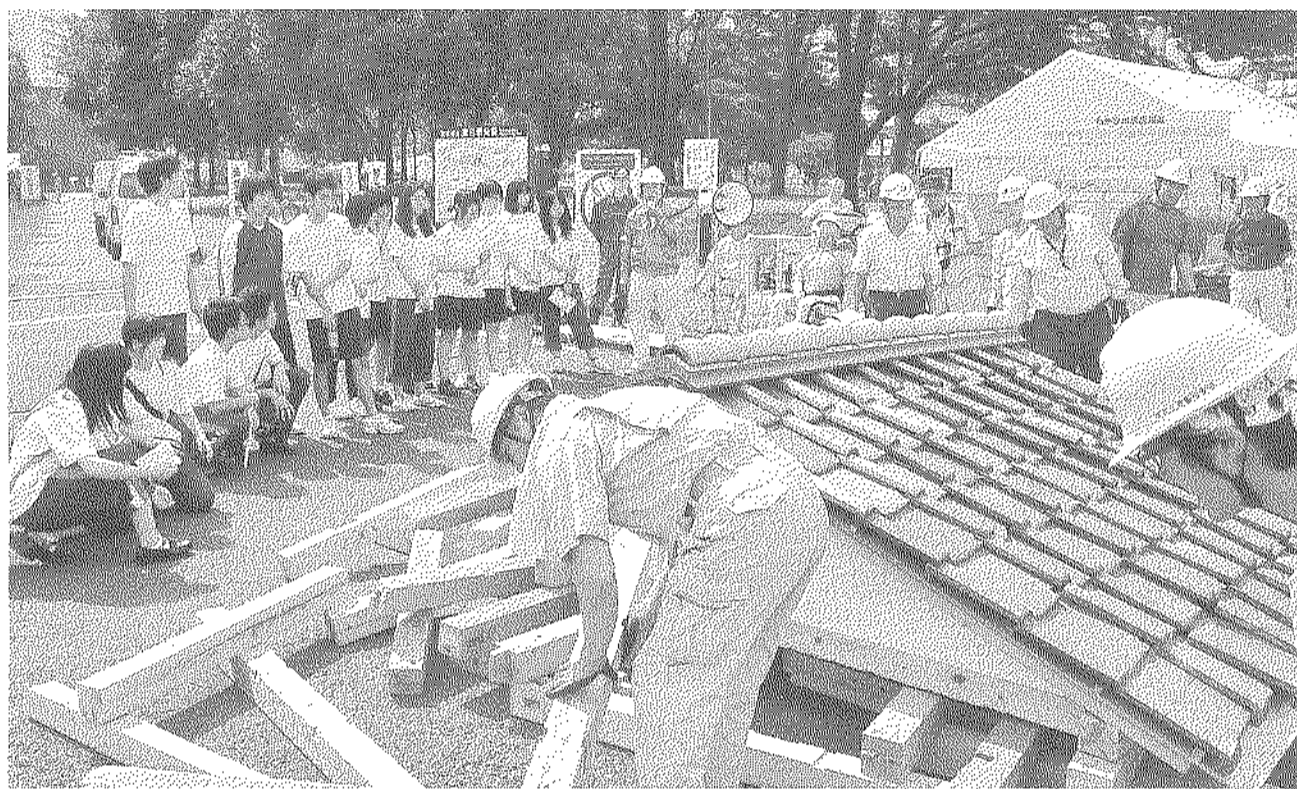
墨田区総合防災訓練で倒壊家屋からの応急救助を実演

田支部でも災害時における応急対策活動を行うため、2008年に墨田区と防災協定を結び、被害軽減に努めるよう備えました。東京土建では災害発生時の「町の救助隊」として各支部で「チームNA MAZU」を組織し、それぞれ地域になくはならない存在であることをアピールしています。その「チームNA MAZU」の墨田支部版として、今回「すみだまちの救助隊ハンマーズ」を結成しました。