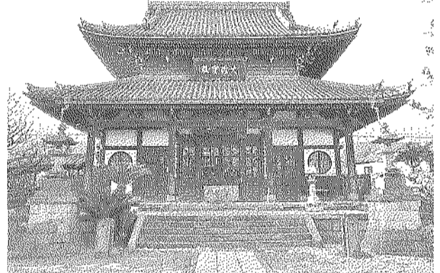
中国色が建物にも表れている弘福寺

長命寺は平安時代代仁 の開山により創建され たとも、慶長年間(1596 ~1615)に創建され