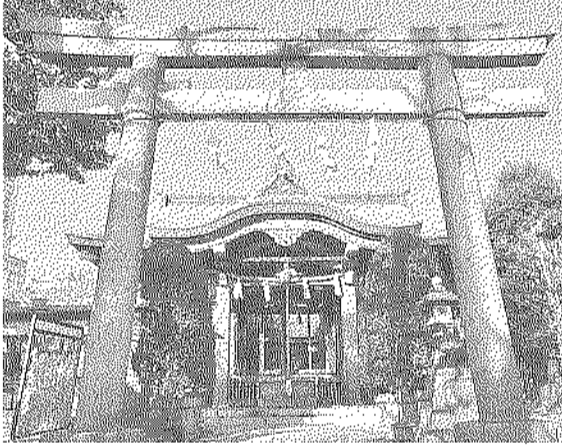
区内最古の神社 白鬚神社

けが見つかりませんでした。皆で思索したところ白鬚神社に白羽の矢が立ち、「白鬚」というからには祭神は老人に違いない」ということになり、「(寿老人ではなく)寿老神」としました。※諸説あり。このようにして生まれ「隅田川七福神」は、墨堤に点在する寺社を墨堤に結びつけた。向島の下の町情緒を味わい、新春を寿ぐ(ことほぐ)ます。