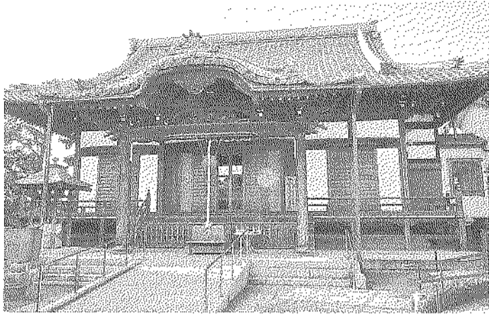
震災も戦災も切り抜けてきた多聞寺