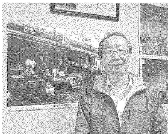
取材に協力して頂いた大和事務局長

「下町人情キラキラ橋商店街」は、その名の通り税率8%引き上げについて、古くから地元住民から愛される商店街として発展してきました。また、昨年12月には経済産業省の「がんばる商店街30選」に選定、全国一千万人以上の商店街のうち、都内で唯一選定された、墨田区では有名な商店街です。