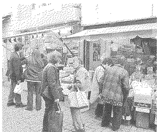
買い物から知り合いとの世間話に

1989年の消費税3%の導入の際には、墨田区商店街連合会で「消費税増税反対」の声を大に上げてきた。しかし、