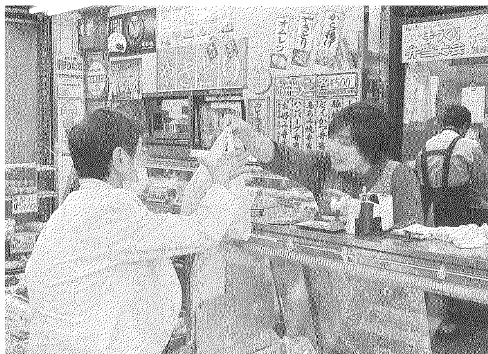
大型店にはない「下町の風情」と「人の温かさ」がここにはある